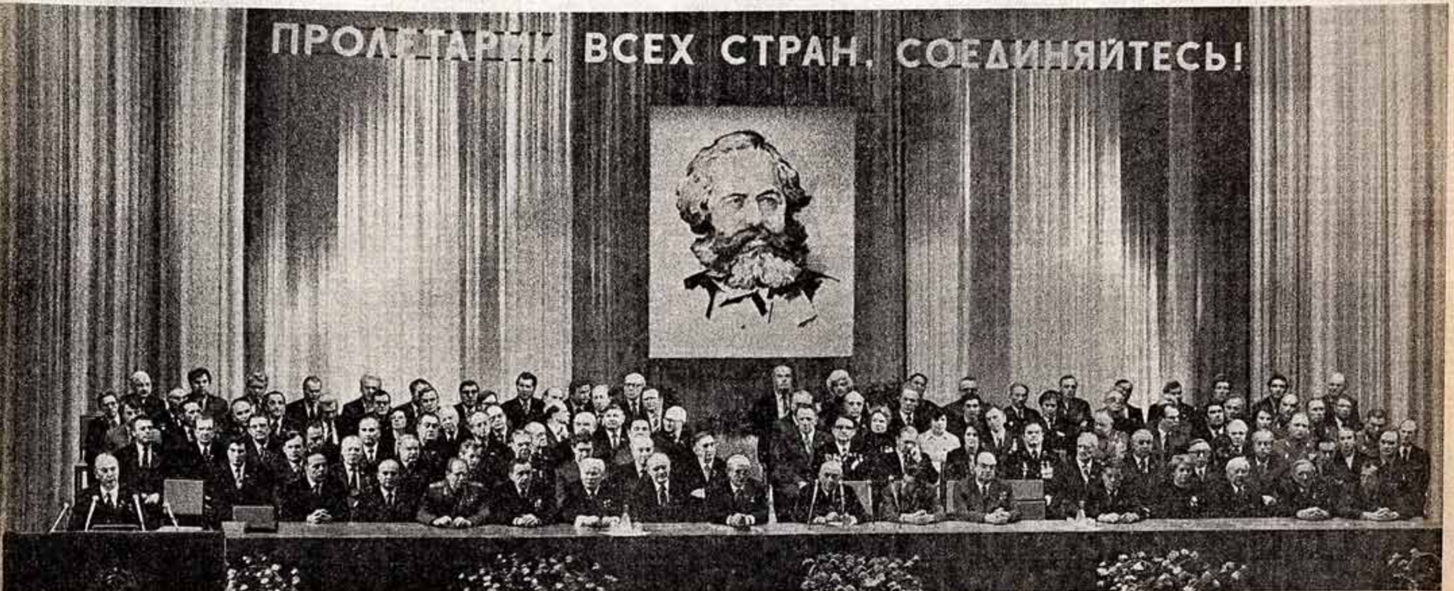
Москва, 30 марта 1983 года. Большой театр Союза ССР. Во время торжественного заседания, посвященного 165-летию со дня рождения и 100-летию со дня смерти Карла Маркса.