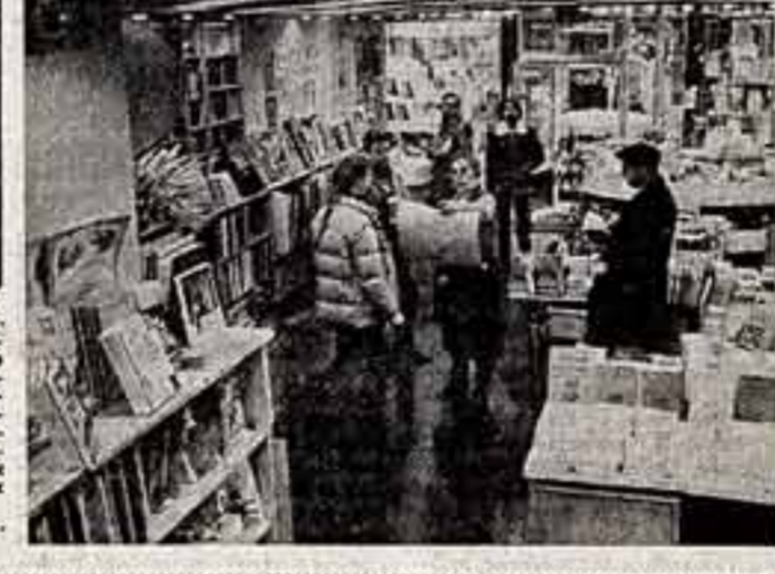
Париж. Многие интеллектуалы французской столицы...