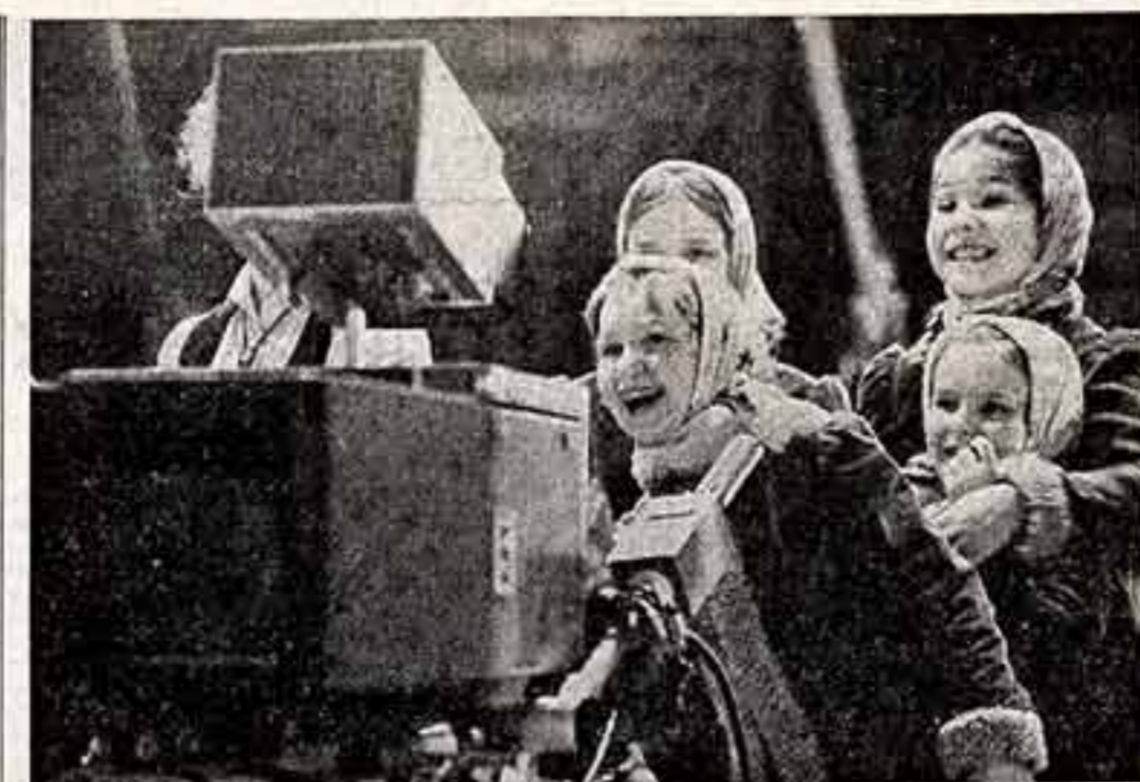
Коллектив Большого детского хора Центрального телевидения и Всесоюзного радио готовится к гастролям в Турцию.