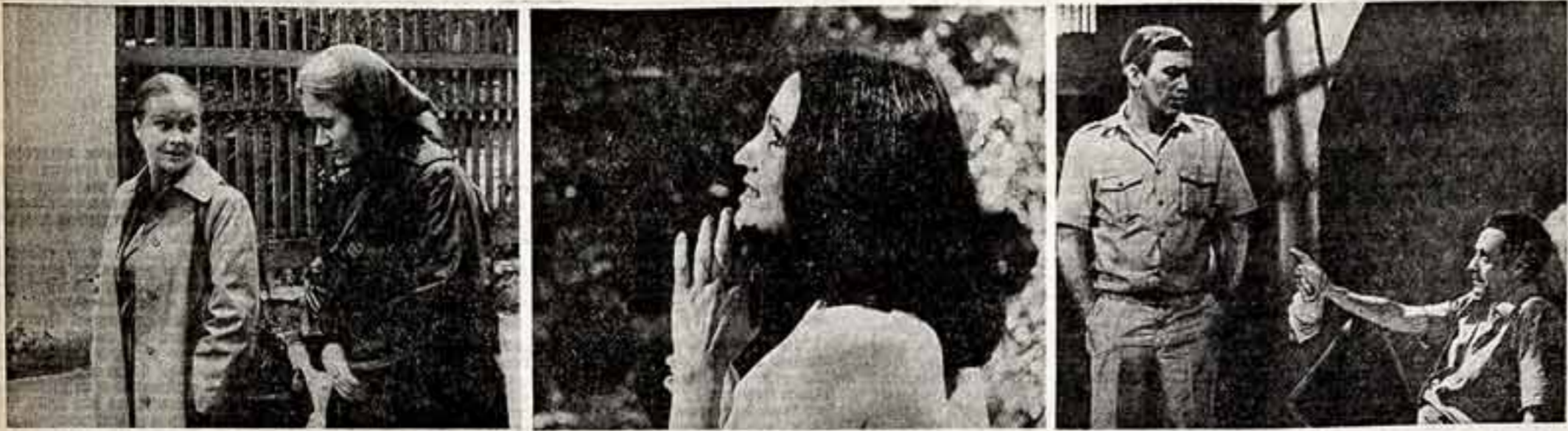
Кадры из картин, представленных на XI Всесоюзный фестиваль телевизионных фильмов: «Хозяйка детского дома» (авторы сценария И. и В. Ольшанские, режиссер В. Креклев, оператор В. Ефимов)...