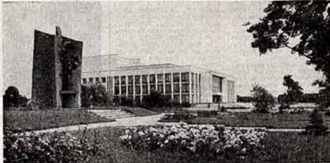
Белорусская ССР. Дворец культуры колхоза «Рассвет» имени К. П. Орловского.