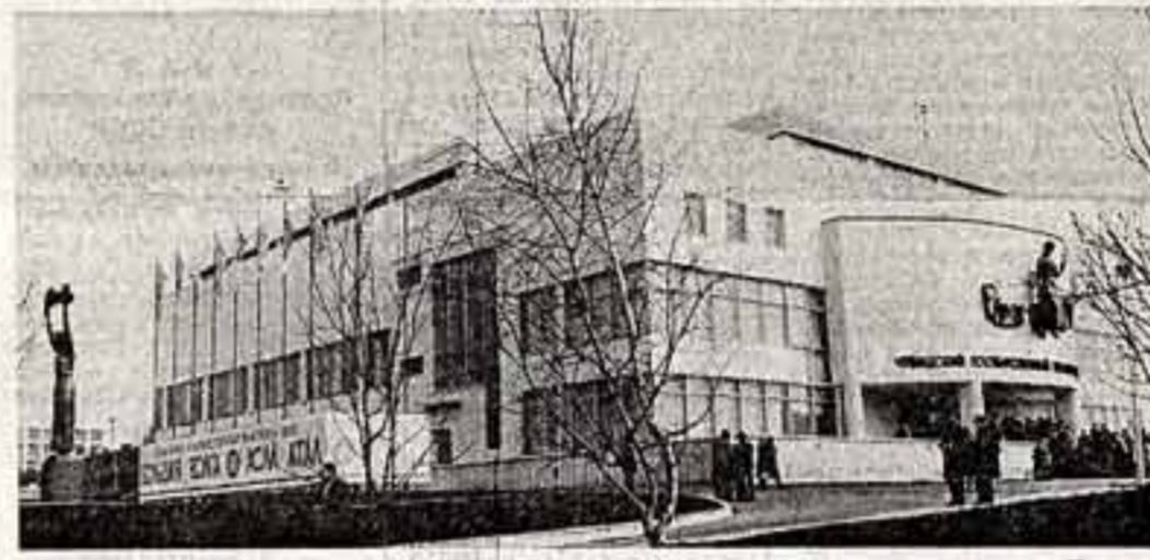
Чувашская АССР. Государственный художественный музей.