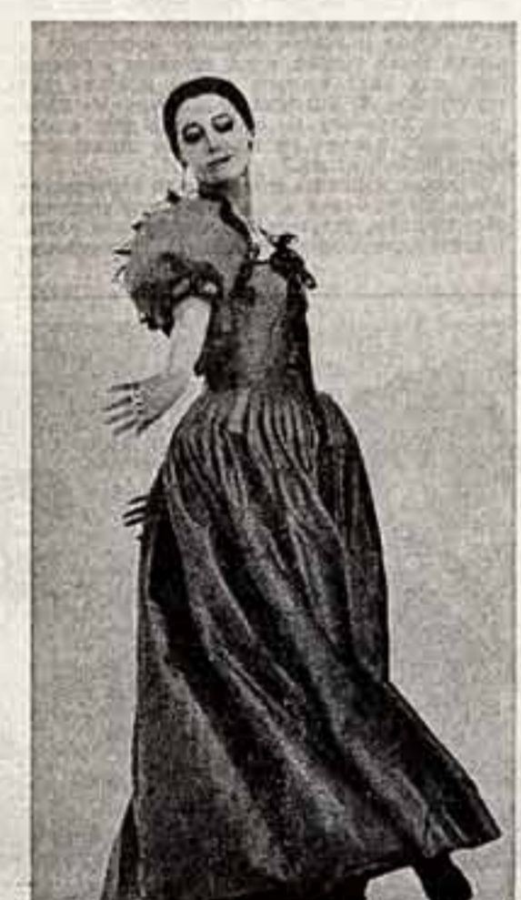
отношение к «Кармен» триумфальное выступление в Испании. К сожалению, так еще бывает.

В свое время, когда принимали «Кармен-сюиты» — кое-кто говорил, что это плохо, что это антиклассика. Понадобилось много лет, чтобы убедиться в обратном.