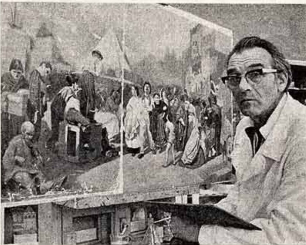
Вновь обретенная картина «Парижские балламы» будет впервые показана на юбилейной выставке работ В. Перова...