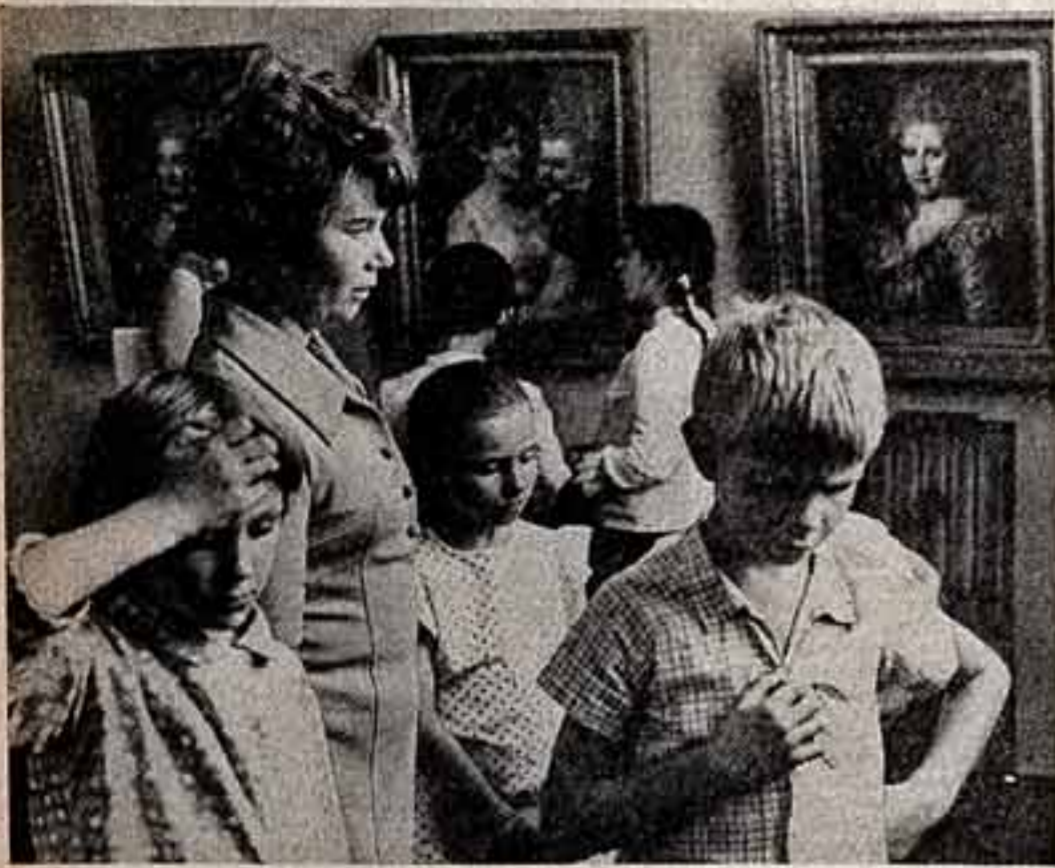
Как прекрасен этот мир...