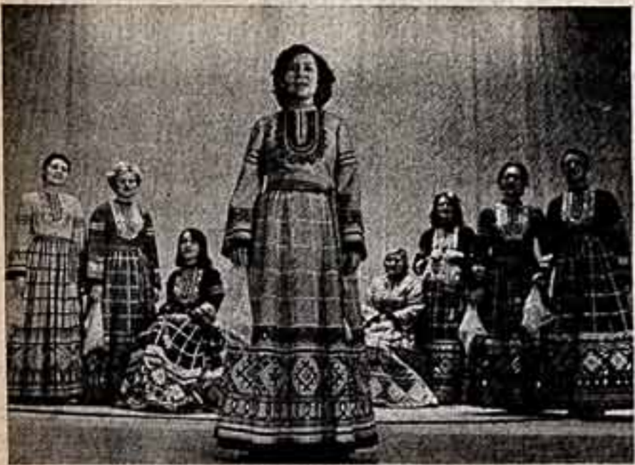
Многие коллективы художественной самодеятельности Пензенской области культуры...