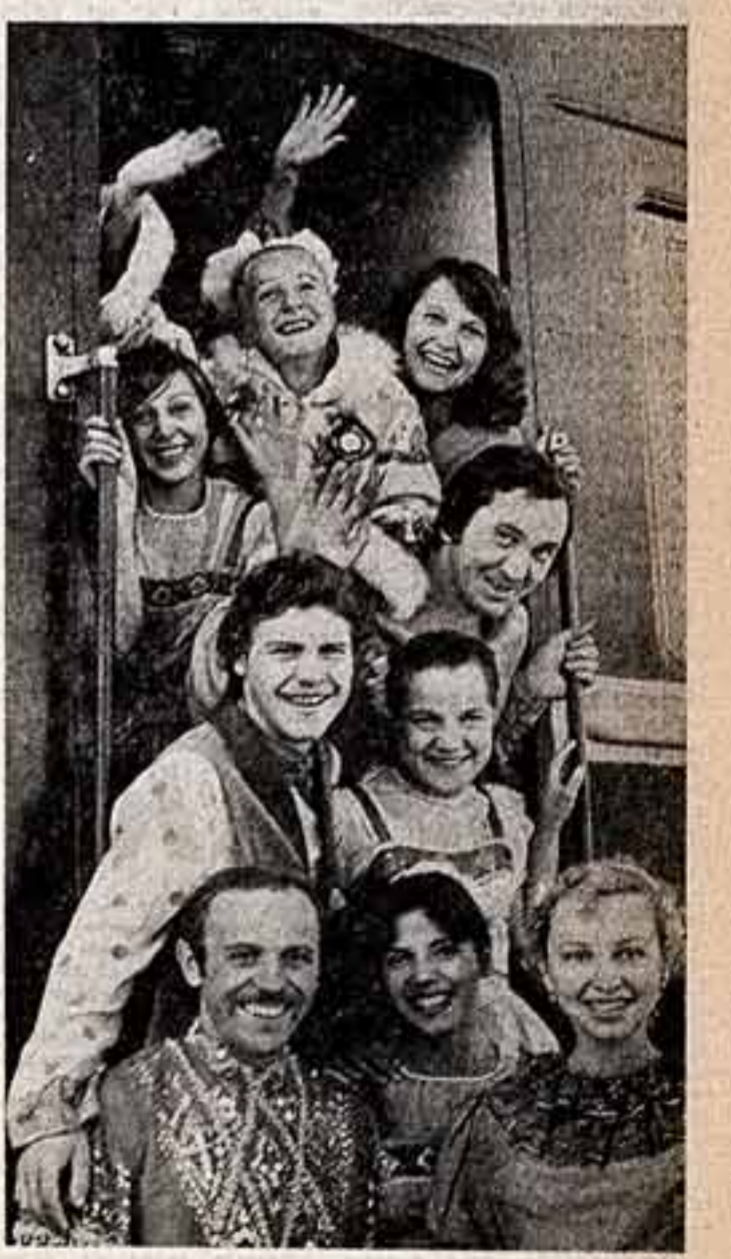
По инициативе трассы Новосибирской области трудится специальная бригада агитаторов, агитаторов, пропагандистов. Они читают лекции по актуальным проблемам современности, ведут беседы о трудовых задачах новосибирцев в десятой пятилетке. В вагоне-клубе размещены картины галерея. Перед началом выступления выступают юные художники самодеятельной самодеятельности.

Участники художественной агитаторов Дворца культуры имени М. Горького у агитаторов.