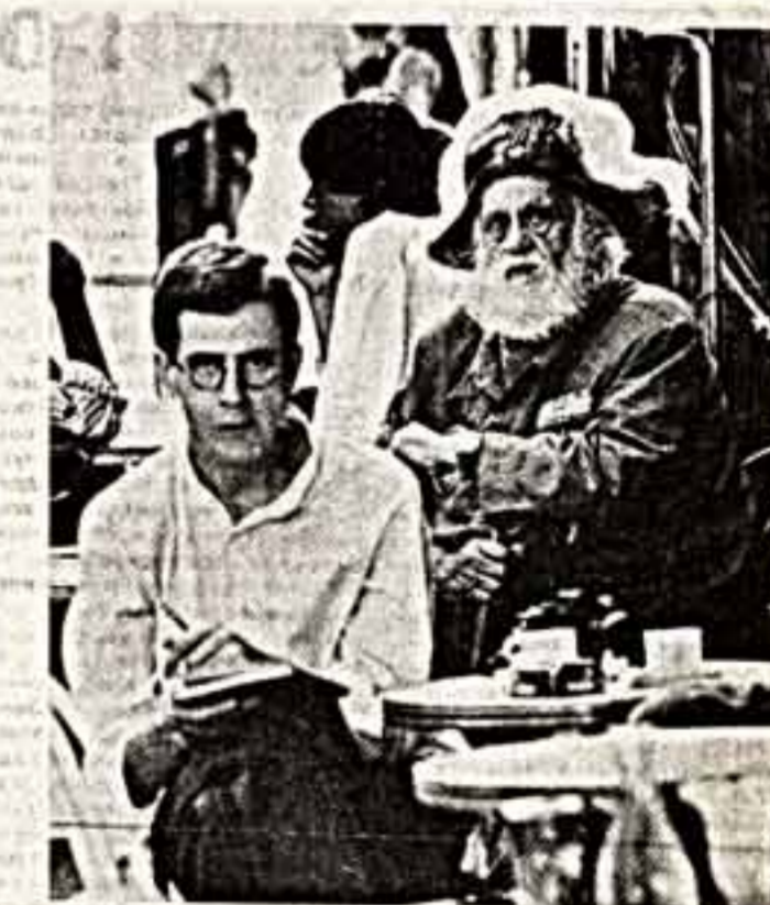
Три сценки на Монмаре.