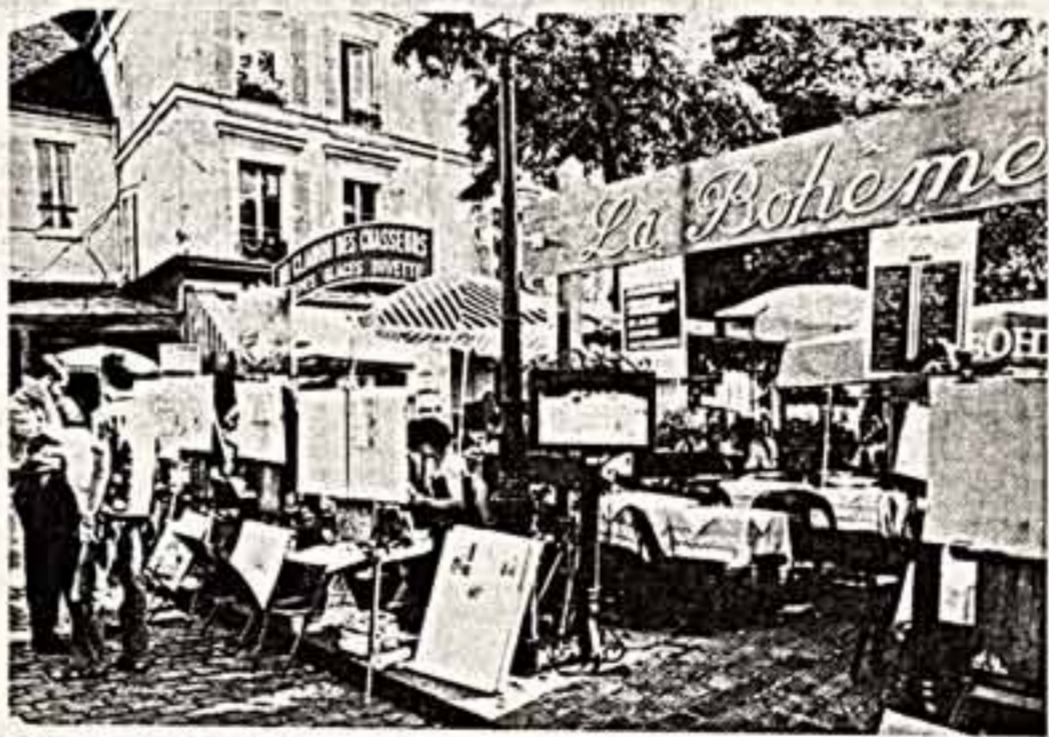
Фоторепортаж из французской столицы В. Корнеева