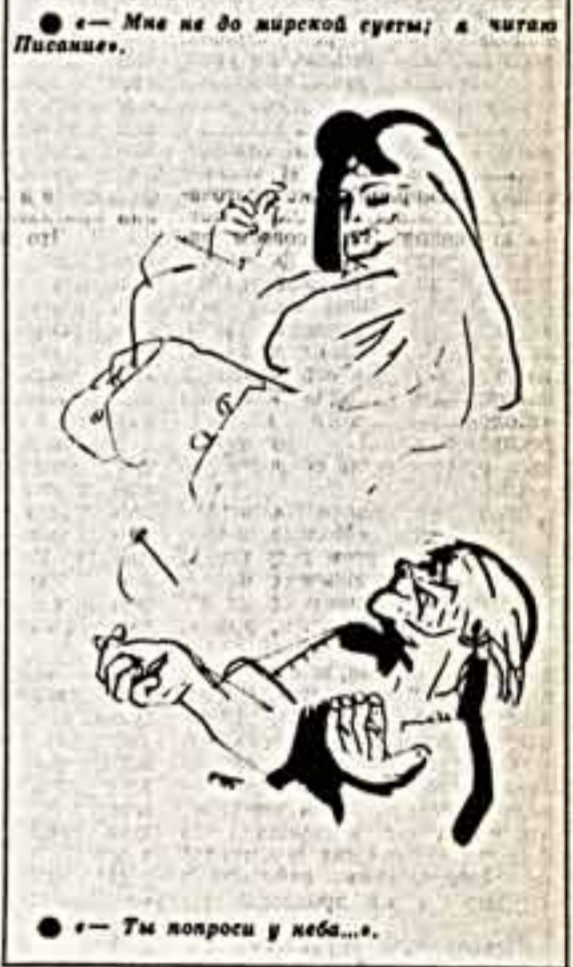
«Ты попроси у неба...».

Давно ли вы были в «Эрмитаже», этом столь любимом ранее москвичами старинном саду? Я лично очень давно. И не потому, что не пускала круговорот дел и забот — не было венами сердца.