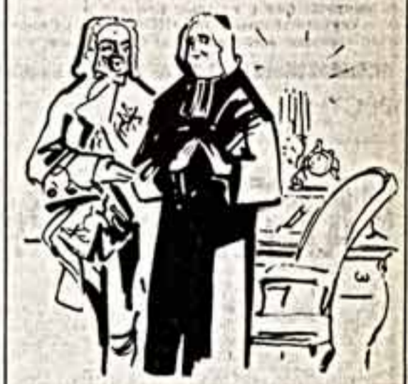
«Мне не до жирской сметы, я читаю Писахова».