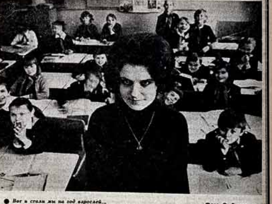
Вот в стенах мы на год взрослые...

Хорошо ли мы знаем наших учителей? Мне лично кажется, что я их знаю. Со многими до сих пор переписываюсь, встречаюсь.