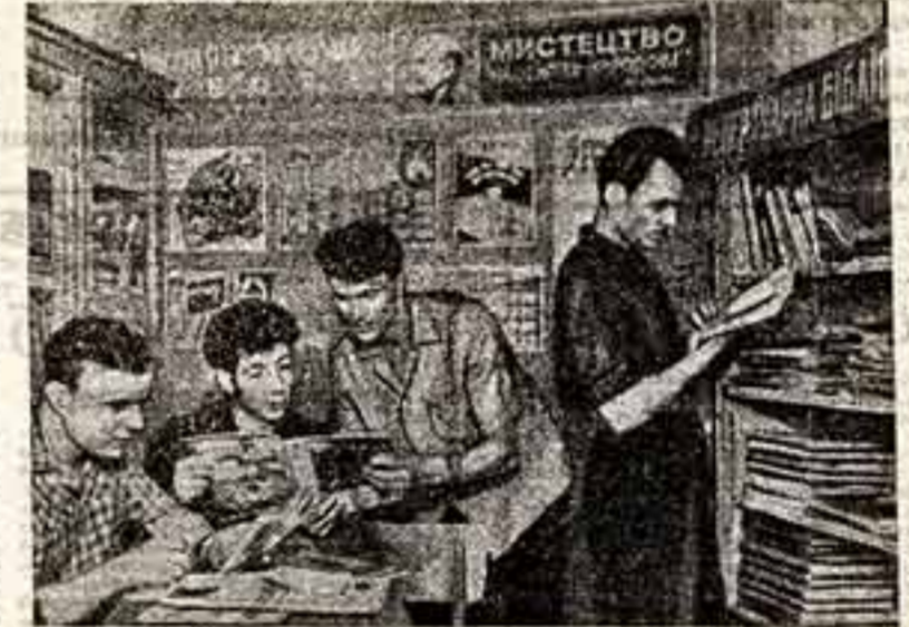
В сельских районах Львовской области созданы специальные репертуарные библиотеки, филиалы областной. В них знакомятся с новинками литературы художественной самодеятельности. На сцене репертуарной библиотеки Сомалянского района.

руку товарищу! Каждый из них взял обязательство в течение года помочь одному-двум клубам стать и ряды передовых. Обязательства эти успешно выполняются. Наконец, областные и районные семинары проводятся в клубах-маяках, большую помощь отстающим оказывают так называемые опорные клубы.