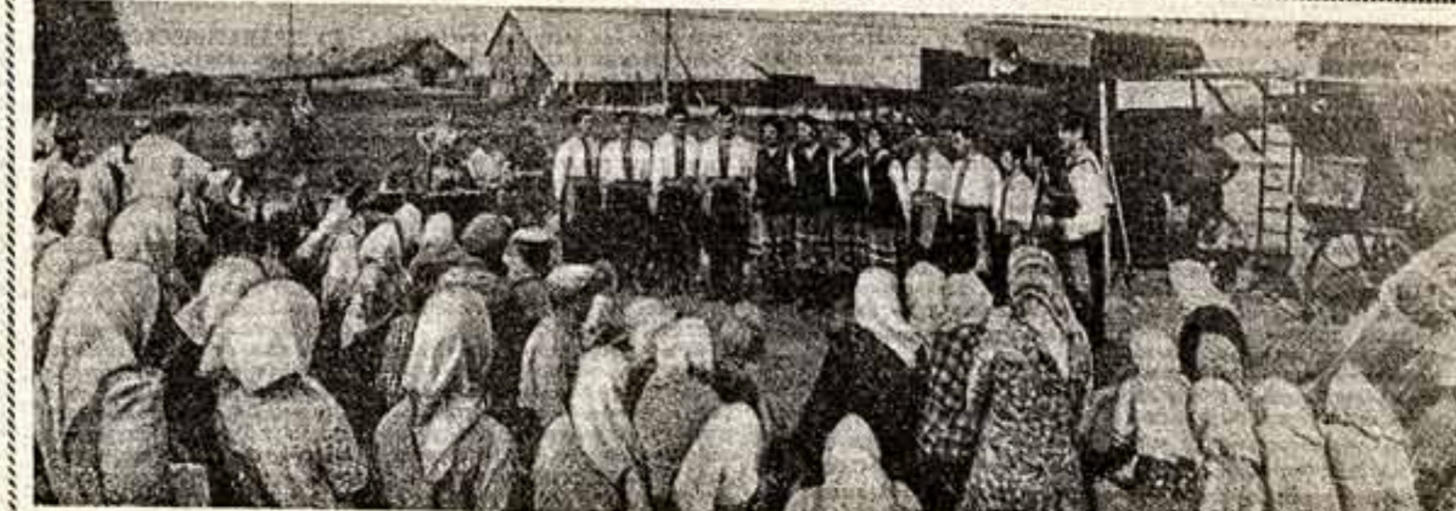
На сцене в обеденный перерыв перед колхозниками выступает агитбригада Сомалянского клуба.