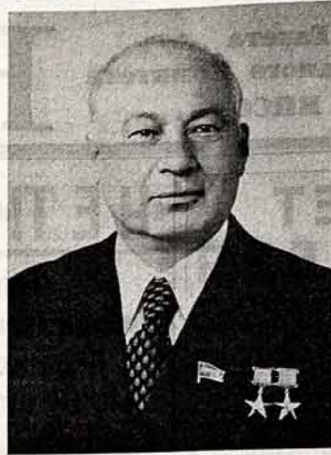
Шараф Рашидович Рашидов родился 6 ноября 1917 года в г. Дивичае Узбекской ССР в семье крестьянина-бедняка. Член КПСС с 1939 года. Окончил Самаркандский государственный университет и Высшую партийную школу при ЦК ВКП(б). Трудовую деятельность начал в 1935 году учителем. В течение ряда лет был на журналистской работе. С августа 1941 года он находился на комсомольской и партийной работе в Советской Армии, участвовал в боях с немецко-фашистскими захватчиками. В 1943 году посылке тяжелого ранения демобилизовался из Советской Армии и работал редактором самаркандской областной газеты. В 1944 году он был избран секретарем Самаркандского обкома партии. С 1947 года являлся редактором республиканской газеты «Низам Узбекистана», впоследствии — председателем правления Союза писателей Узбекистана. С 1950 по 1959 год Ш. Р. Рашидов был Председателем Президиума Верховного Совета Узбекской ССР и по 1960 году — заместителем Председателя Президиума Верховного Совета ССРСР, с 1970 года — член Президиума Верховного Совета СССР.

31 октября 1983 года сороклетием исполнился кандидат в члены Политбюро ЦК КПСС, первый секретарь ЦК Компартии Узбекистана, член Президиума Верховного Совета СССР Шараф Рашидович Рашидов. Видный деятель Коммунистической партии и Советского государства, он всю свою жизнь посвятил великому делу строительства коммунизма.