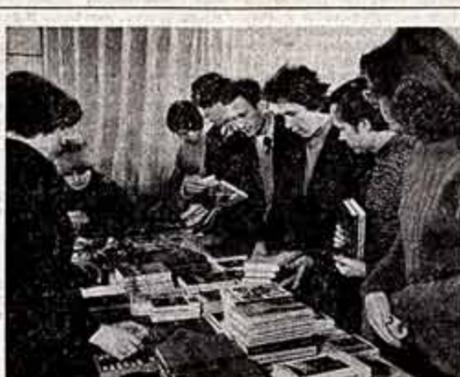
Широкое распространение в Тюменской области получила важная работа по созданию библиотек в районах нефтедобычи. В центре — читальня в поселке Пионерный.