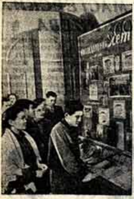
Алма-Ата. Трудящиеся столицы Казахстана готовятся к празднованию 300-летия воссоединения Украины с Россией. В библиотеках города открываются книжные выставки, отражающие великую дружбу русского и украинского народов. Большая выставка, посвященная знаменитой дате, открылась в Государственной публичной библиотеке Казахской ССР имени А. С. Пушкина.