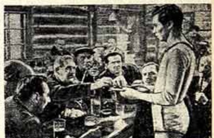
Награда от сострадательных зрителей. Кадр из фильма «Комедианты».

Постановление правительства Чехословацкой Республики ставит перед работниками нашей кинематографии важную задачу — перейти на съемку только цветных фильмов. Это весьма сложное задание, так как его выполнение связано с необходимостью технически переоборудовать наши