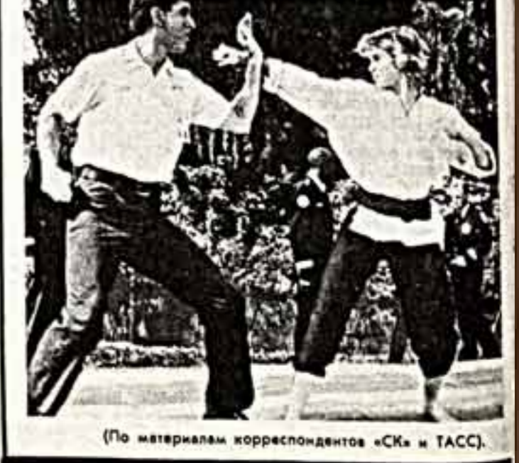
(По материалам корреспондентов «СК» и ТАСС).

Мэтт Ван Кой, Джимми Димонс, Джордж Гейнс, Дэвид Графф — эти имена известных авторов мало кому известны в нашей стране. Но в США они очень популярны благодаря тому, что снимаются в типично юмористическом художественном фильме, режиссера Стюа Гуттенберга «Полицейская академия».