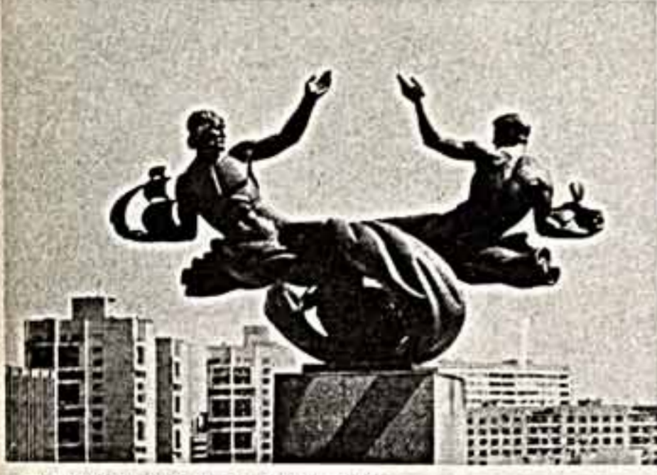
Ленинград, у гостиницы «Прибалтийская».