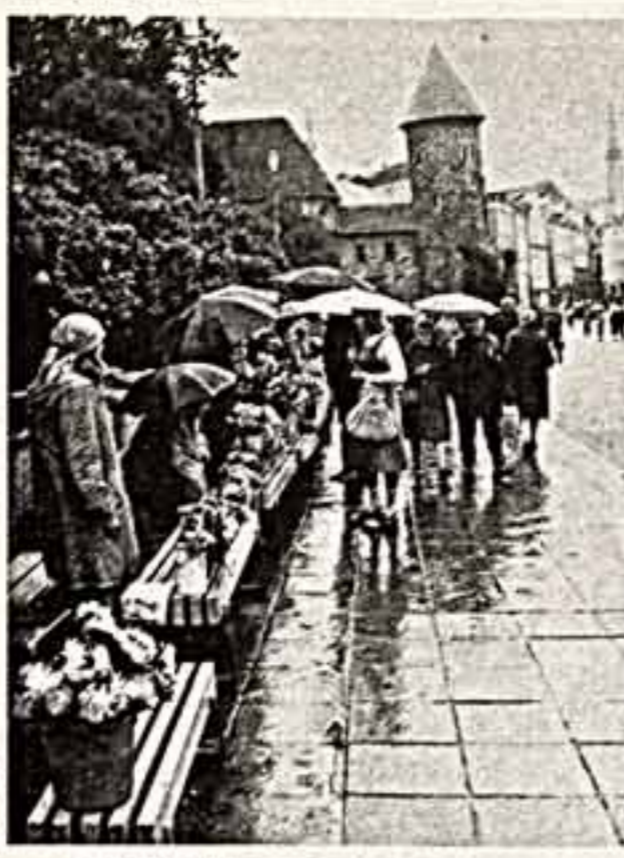
В старом Таллине.