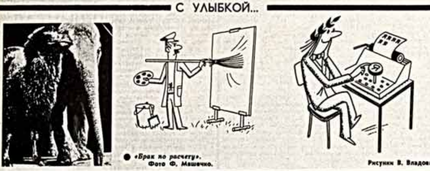
«Врех по расчёту».