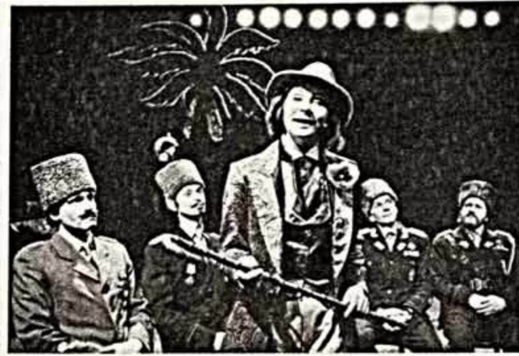
В Государственном театре юного зрителя Латвийской ССР впервые осуществлена постановка спектакля «Изабелла Вальза»...

Иногда, чтобы на конференции повалить людей, которые не будут флагом, голосующим за то угодно, которые знают, что делать, и делают, люди будут очень нужны на конференции. Им не должно опростраиваться на выборах, если они хотят, чтобы перестройка была неотратной.