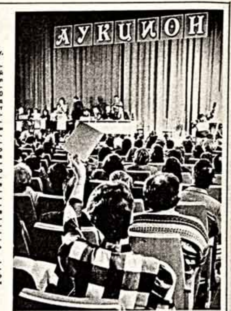
В. НОВИКОВ. ЛЕНИНГРАД.

«Старая книга» и Литературное кафе — приметная достопримечательность современного Ленинграда. Буквистический магазин хранит облик антикварного магазина прошлого века. Здесь полно народу, можно встретить известных коллекционеров, любителей старины, работников библиотек. Они, правда, сетуют, что в последнее время стало трудно приобрести редкие книги.