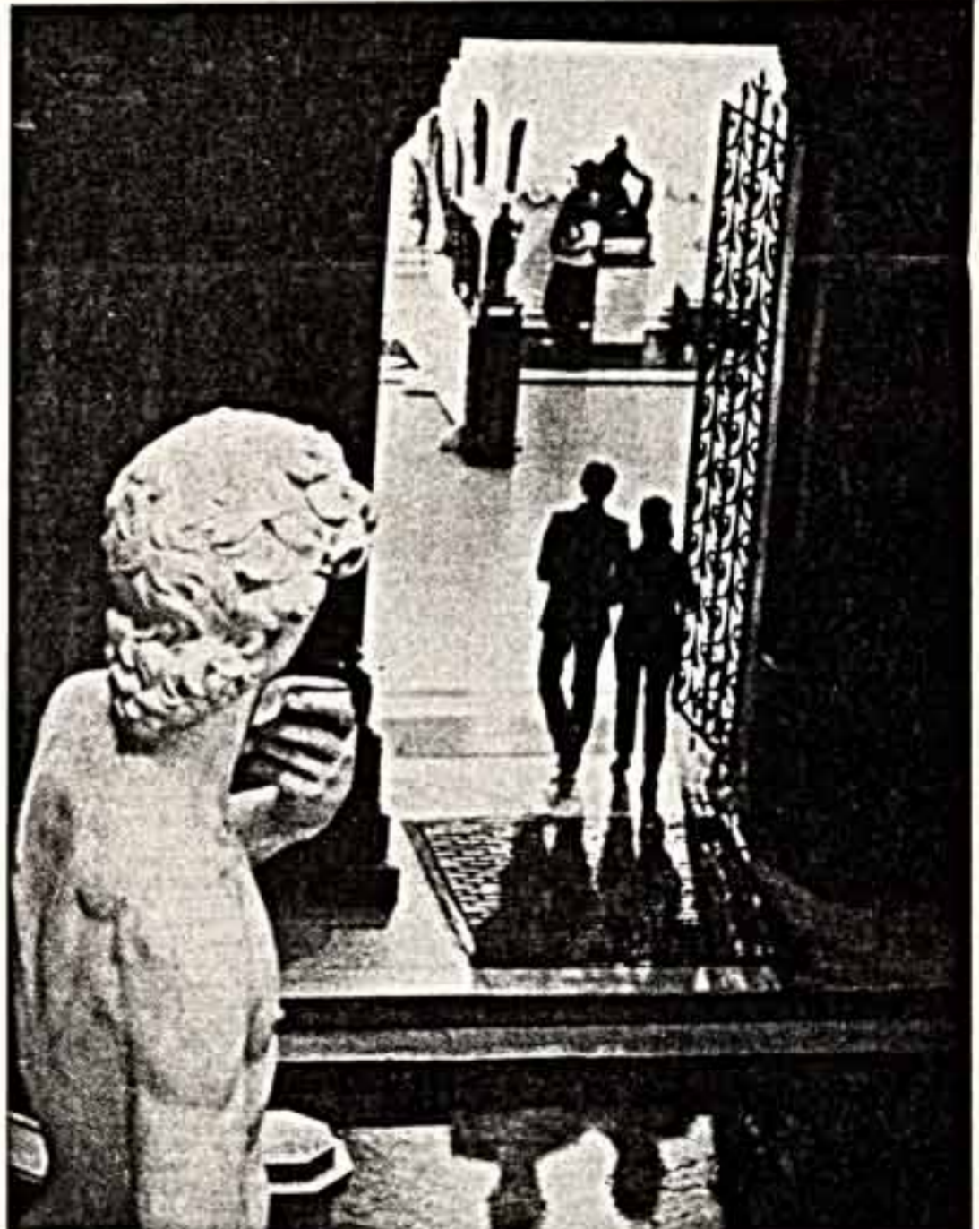
С. ЖАВН. В музее.