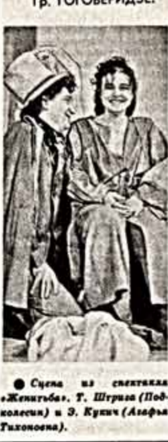
Сцена из спектакля «Женитьба» Т. Штрипа (Подольск) и Э. Кухин (Алфийск).

сказать, что все это мелочи и не стоит об этом говорить. Не согласна с вами. Любое заранее размыленное действие подрывает авторитет собрания, порождает скептические усмешки в зале, а значит, снижает градус деловитости форума.