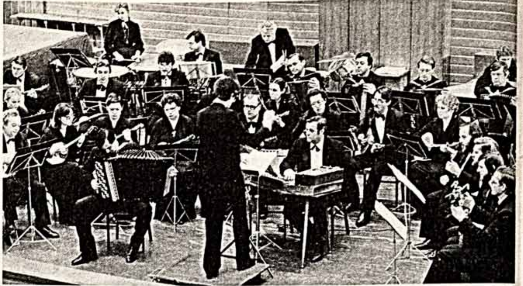
Выступления оркестра русских народных инструментов Новосибирского радио и телевидения пользуются большой популярностью у любителей музыкального искусства. Помимо концертов на радио и телевидении, коллектив много гастролирует по области.