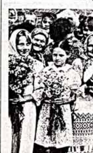
В этот день Хмелита встречала гостей хлебом-солью, смородиной и крыжовником. Была армарна с самоварами, с чаем на мятых зверобоевых блинчиках и хороша...

Состоится всесоюзный грибоведский праздник в селе Хмелита. Его организаторы — Смоленский обком КПСС, Министерство культуры РСФСР, Советский фонд культуры, Пушкинский дом и газета «Советская культура».