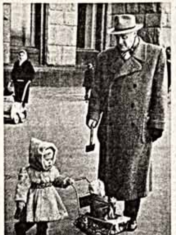
латвийский писатель В. Лацис (1947 год). Народный артист СССР Н. Черкасов на борту теплохода «Валтика» (начало 60-х годов). Народный артист СССР М. Жаров на прогулке с дочерью (1933 год).