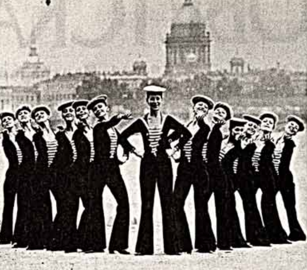
География гастролей ансамбля песни и пляски ордена Ленина Ленинградского военного округа простирается от Украины и Белоруссии до Дальнего Востока и Средней Азии. С интересом идут его выступления на северо-западе, где страны — это зона постоянного внимания коллектива. Неоднократно ансамбль представлял советское армейское искусство за рубежом.