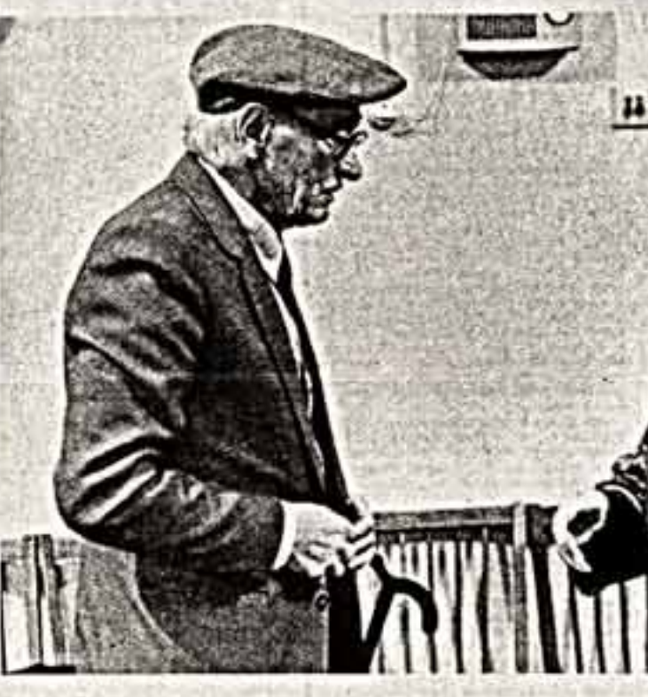
С ВЕРОЙ В ПОБЕДУ ДОБРА

Профессиональные и самодеятельные артисты прочитали рассказы Шукшина, показали отрывки из спектаклей, поставленных по его произведениям. В исполнении фольклорных коллективов звучали любимые песни из знаменитого землячка. (ТАСС).