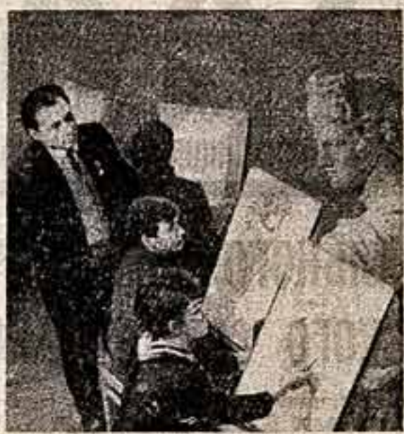
Идет урок рисунка.