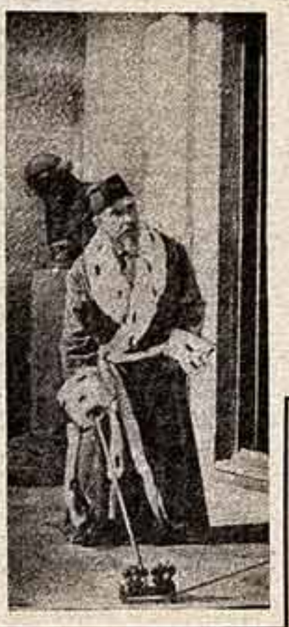
«С ОВСЕМ КАК В ЖИЗНИ» — такова формула творческих исканий многих кинематографистов наших дней.

Не лавиною, а натуре, не перевоплощение актёра, а естественное поведение в любых обстоятельствах, не монтажные находки, а ровное течение жизни, планы, слова, обаяющая правда знакомой и все-таки новой узнаваемой действительности — вот к чему причащает нас кинорежиссер, выдержанный в строго современной манере.