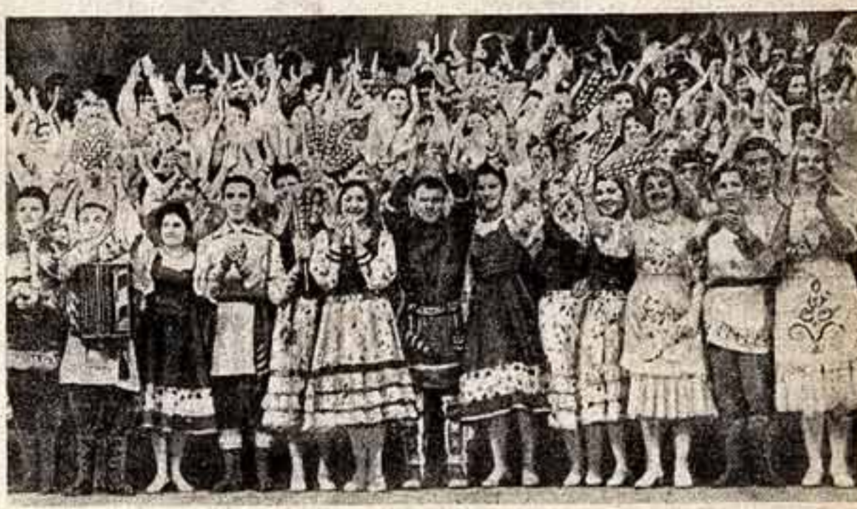
Участники заключительного концерта отвечают на приветствия зрителей.

В прениях выступили тт. П. Ф. Ломано [председатель Госплана СССР], И. Г. Кубин [первый секретарь ЦК КП Эстонии], И. И. Бодюл [первый секретарь ЦК КП Молдавии], Я. Н. Зарбян [первый секретарь ЦК КП Армении], А. Ю. Снечук [первый секретарь ЦК КП Литвы], Б. Овезов [первый секретарь ЦК КП Туркменистана]. В заключение с краткой речью выступил Первый секретарь ЦК КПСС тов. Л. И. Брежнев. Пленум Центрального Комитета КПСС единодушно принял постановление «О неотложных мерах по дальнейшему развитию сельского хозяйства СССР». По второму вопросу повестки дня Пленума «Об итогах консультативной встречи представителей коммунистических и рабочих партий 1—5 марта 1965 г.» с сообщением выступил секретарь ЦК КПСС тов. А. А. Суслов. Пленум единодушно принял постановление по этому вопросу. Пленум ЦК КПСС рассмотрел организационные вопросы. Пленум перевел тов. К. Т. Мазурова из кандидатов в члены Президиума ЦК КПСС. Пленум избрал тов. Д. Ф. Устинова кандидатом в члены Президиума ЦК КПСС и секретарем ЦК КПСС. Пленум освободил тов. Л. Ф. Ильичева от обязанностей секретаря ЦК КПСС. На этом пленум закончил свою работу.