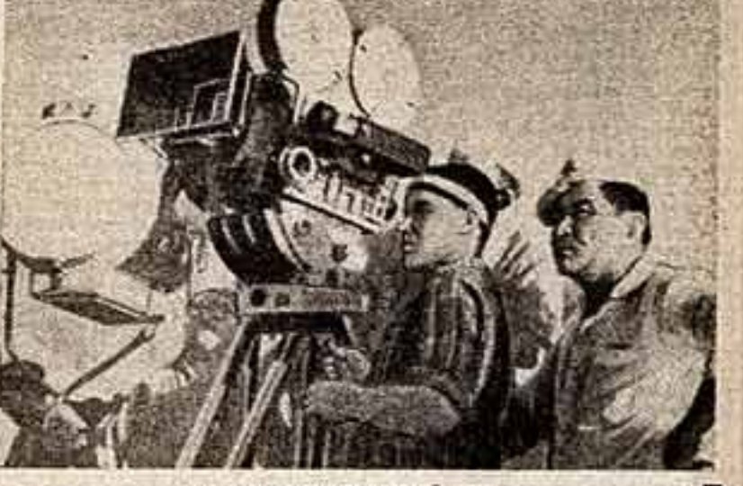
— И исполнителем главной роли.