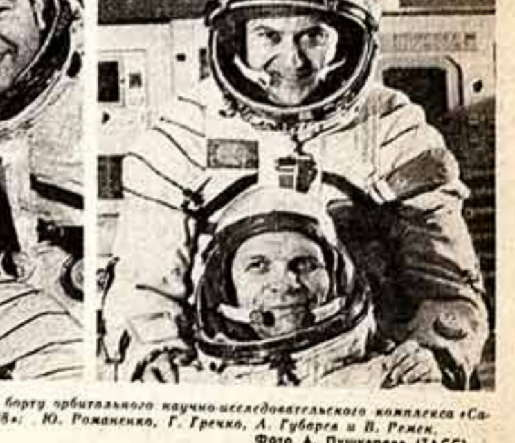
Они работают вместе на борту орбитального научно-исследовательского комплекса «Союз-6» — «Союз-27» — «Союз-28»: Ю. Романенко, Г. Гречко, А. Губарев и В. Ремец.

ЦК компартий союзных республик, крайних, обкомов, райкомов, обко-