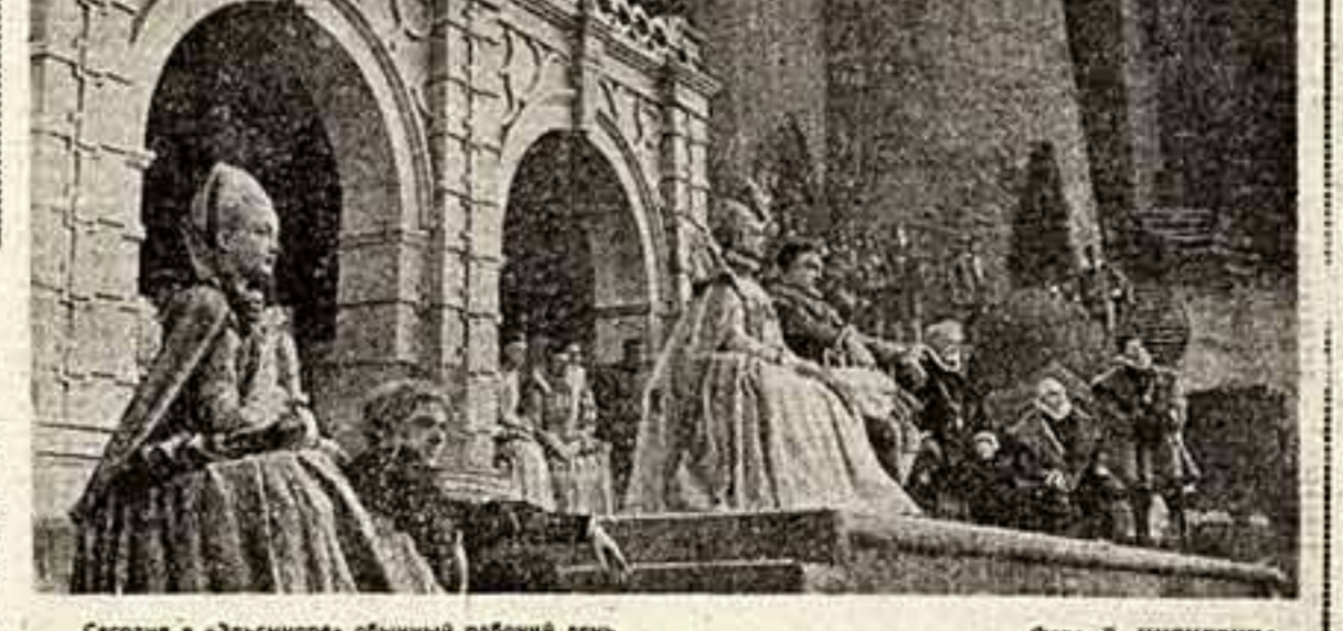
Сегодня в «Эльсиноре» обычный рабочий день.

Около 200 замечательных работ русских и советских художников, графиков и скульпторов увидят свердловчане в «Малой Третьяковке».