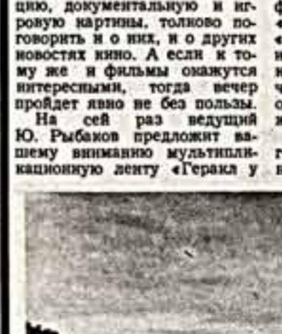
«Кадр из художественного кинофильма «Получук» (авторы сценария — П. Лукин, Н. Киселевич, режиссер Н. Киселевич). По ЦТ показывается впервые.»