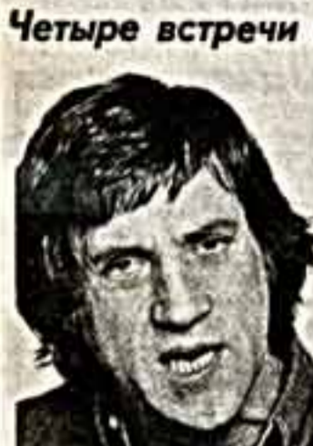
— 1 пр., 19.50 и 21.30; 26 и 27 января — 1 пр., 21.58. Из воспоминаний режиссера С. ГОВОРУХИНА.

«Артисты считали его своим. Верили, что он опытный воспитатель...»