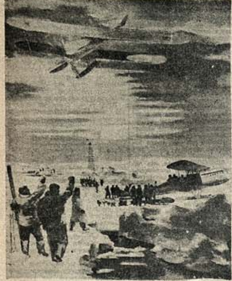
Г. «Спасение челюскинцев»