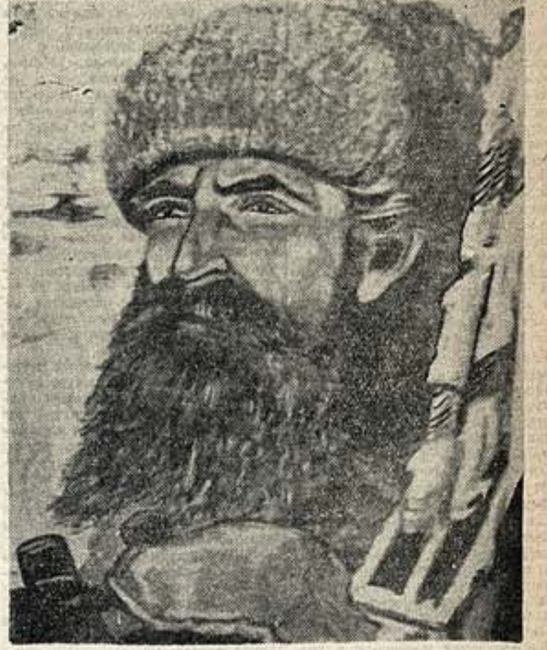
О. Ю. Шмидт.