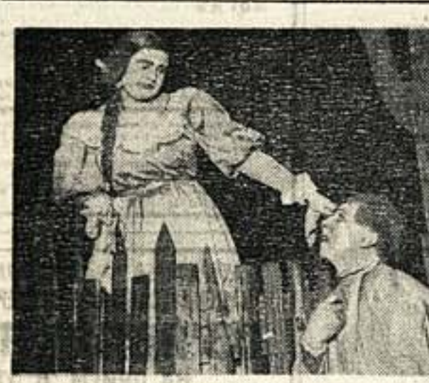
II колхозный театр «Не было ни гроша, да вдруг алтын»