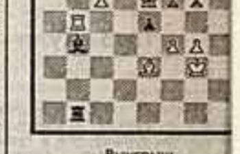
Выигреш Автор — югославский гроссмейстер, профессор, с видным учением в области этротехники.

«Они и не осознали ничего, я же видела в суде: уголовные преступницы, так и надо считать».