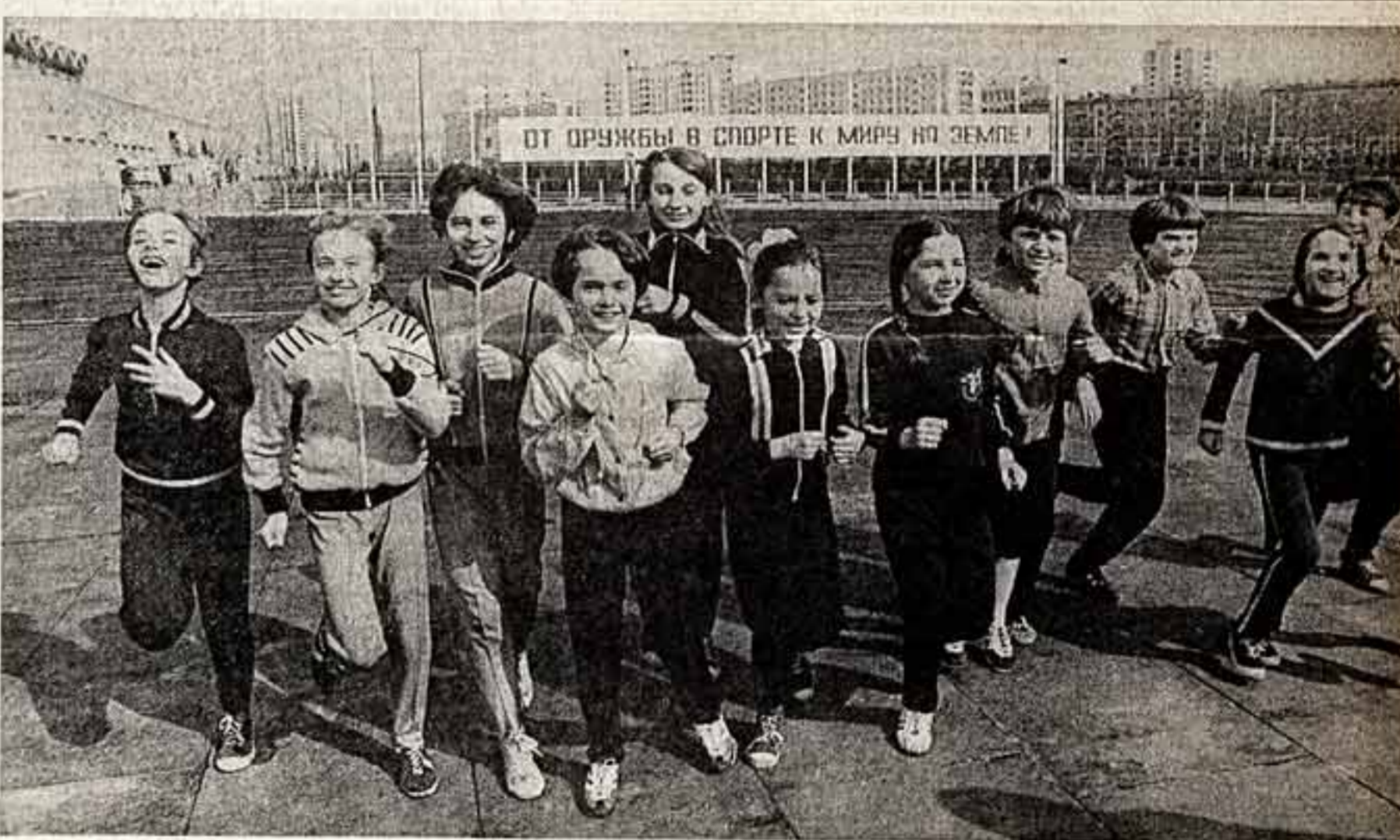
На московской студии автозавода им. Ленинского комсомола.

На заседании Политбюро ЦК КПСС приняты также решения по другим вопросам партийной и государственной жизни.