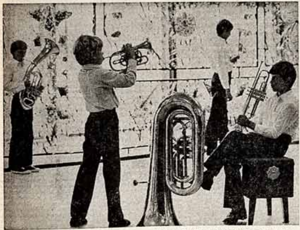
Высокие доходы позволяют колхозу имени XXII съезда КПСС Судзальского района Владимирской области успешно выполнять план социального развития. Ежегодно на строительство и благоустройство центральной усадьбы и деревень расходуется более миллиона рублей. ● В Дворце культуры во время репетиции детского духового оркестра.