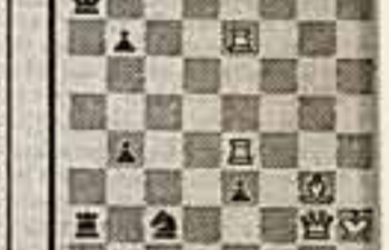
Мат в 2 хода Эти задачи инженера из ФНИ заняли первое место в конкурсе болельщиков журнала «Шахматный мыслитель».