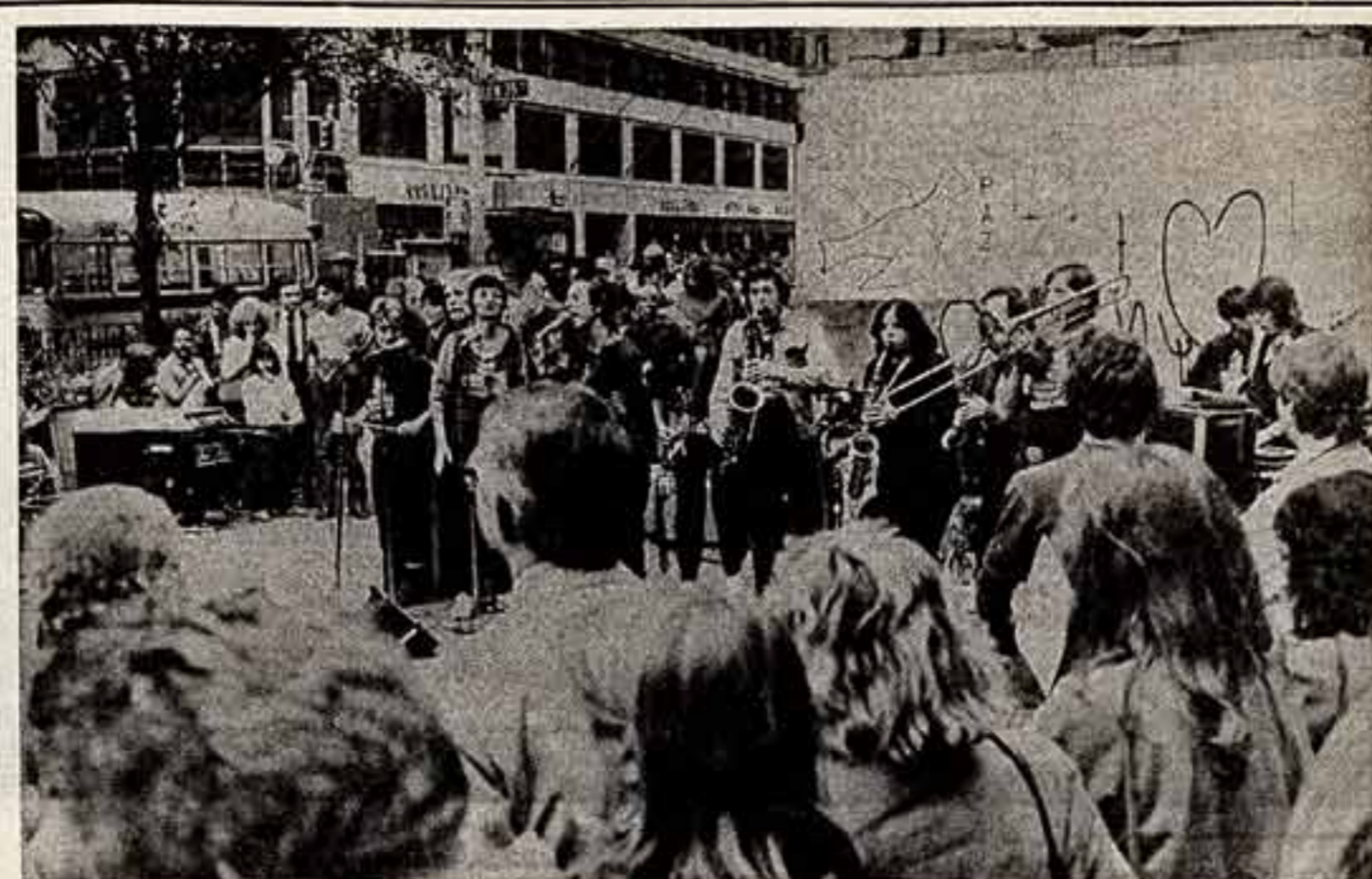
Мужество и стойкость никарагуанского народа, готового любой ценой отстоять завоевания сандинистской революции...