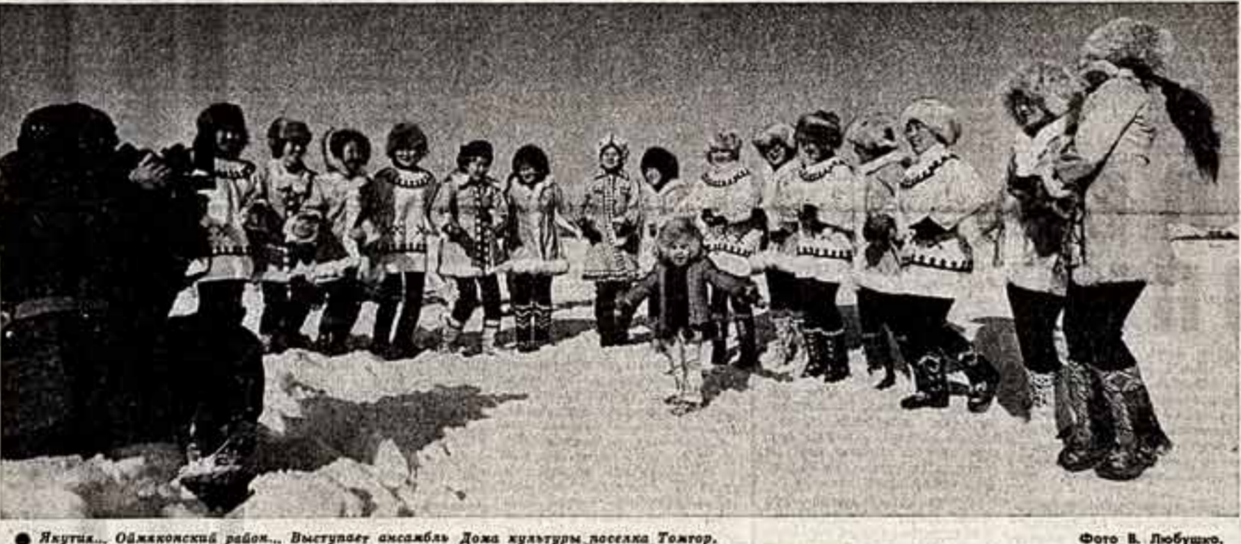
Якутия... Оймяконский район... Выступает ансамбль Дожа культуры поселка Томтор.

В самый канун Нового года в концертном зале Государственного музыкального училища имени Гнесиных прошел фестиваль учащихся музыкальных учебных заведений столицы и Подмосковья.