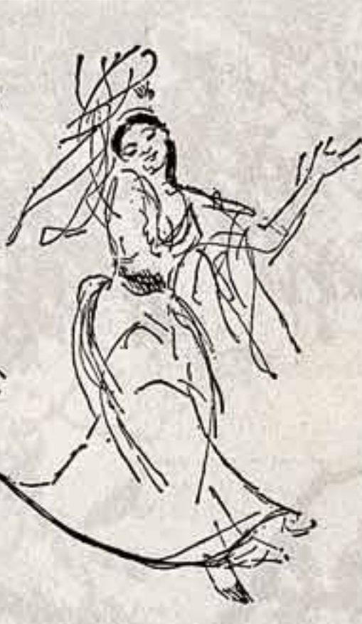
Харуф Индстру... Напоминает молодых людей, не знающих, но знающих датчан, нередко окрашенных добрым юмором...