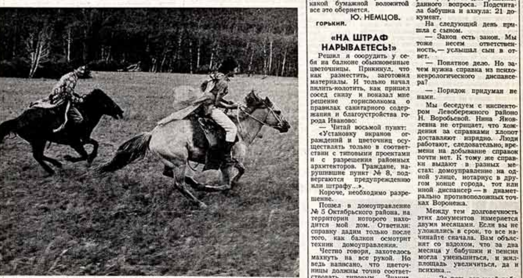
ФОТОКОУРС Е. КИАНЧИЦЕВ. «Попробуй догони!»

История, в которой мы начали эти заметки, имеет счастливый конец. После вмешательства газеты вилейский завод «Зенит» еще раз заменил А. Мажугу фотоаппарат «Эликон-35С».