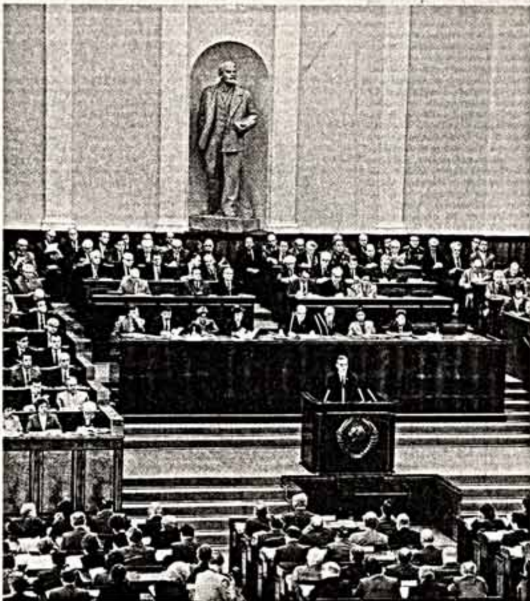
В зале заседаний Верховного Совета СССР в Большом Кремлевском дворце.

разрешения советских, хозяйственных и иных органов. Они организуются по желанию граждан исключительно на добровольных началах. Любая кооперативная инициатива, наделенная правом беспрепятственно зарегистрировать его в исполкоме местного Совета народных депутатов. С общего дохода кооператива устанавливаются относительно низкие твердые ставки налога. Это в сочетании с прогрессивным налогом обложением заработка делает выгодным большую часть доходов направлять на расширение и модернизацию производства, на улучшение продукции, на социальные нужды коллектива. (Окончание на 2-й стр.)