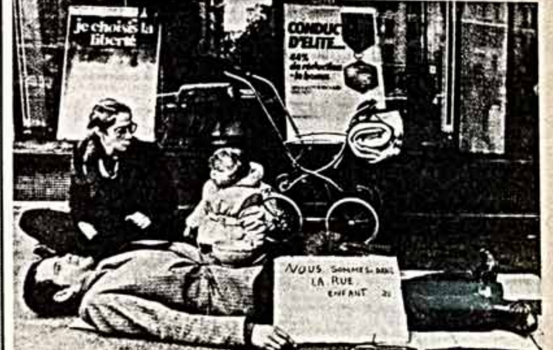
Трагедия этой французской семьи, озаглавленной на улице, прокомментирована самой подругой писателя, опубликованном журналом «Нувель обсерватор» тиражом в 400 тысяч, не имеющих будущего...

Светлана БАЛАШОВА. (Корр. «Советской культуры»). СОФИЯ.