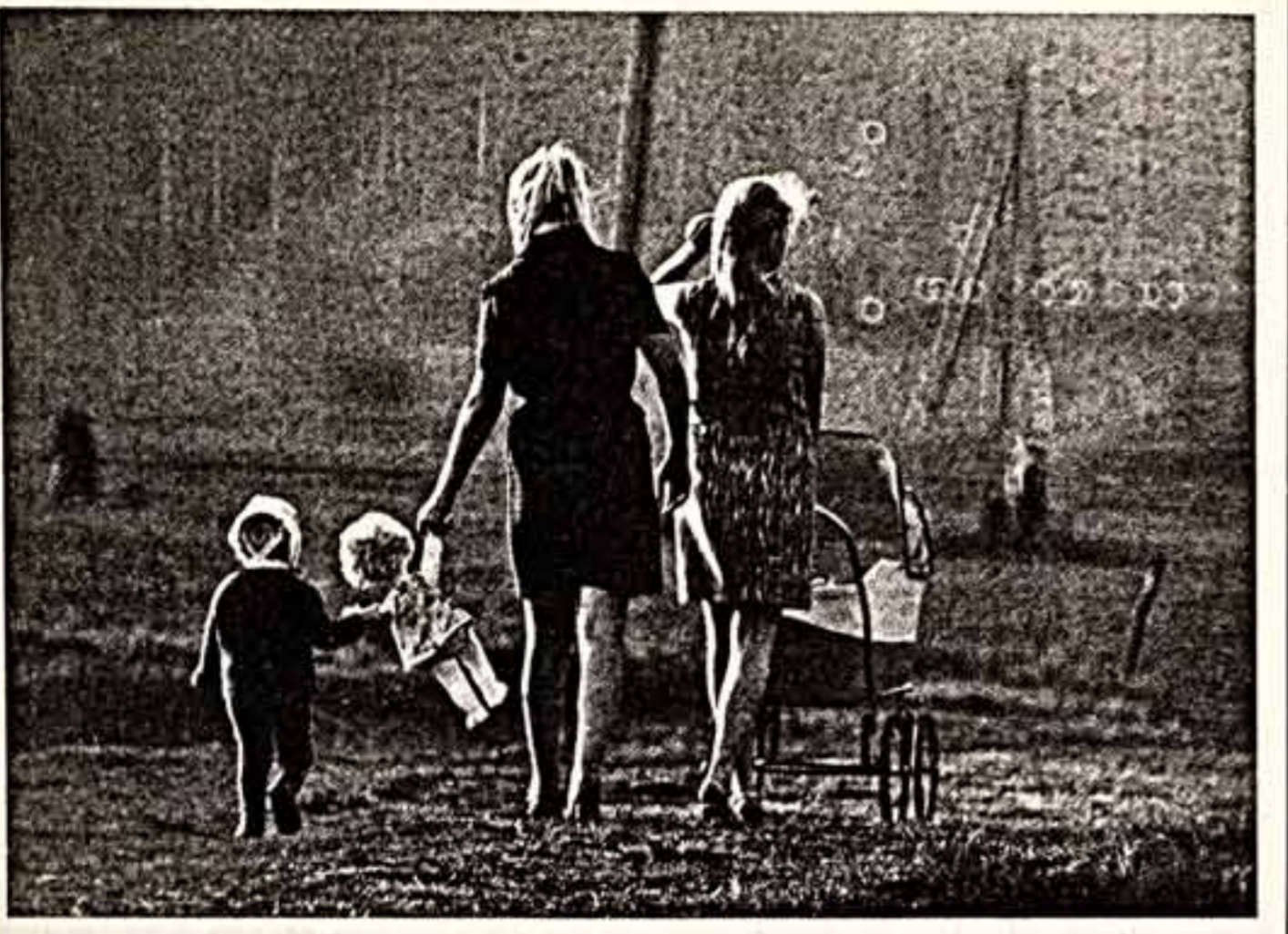
НА ФОТОКОНКУРС ● Н. УВАСЕВ. «На прогулку».

Группа ленинградских десятиклассников из школы № 149 решила выйти на первомайскую демонстрацию с нетрадиционным лозунгом: «Каждому — по труду!».