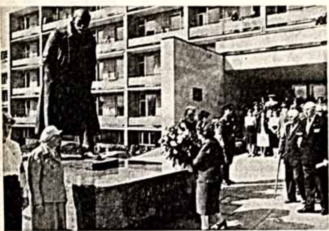
Открытие памятника основателю Советского государства В. И. Ленину...