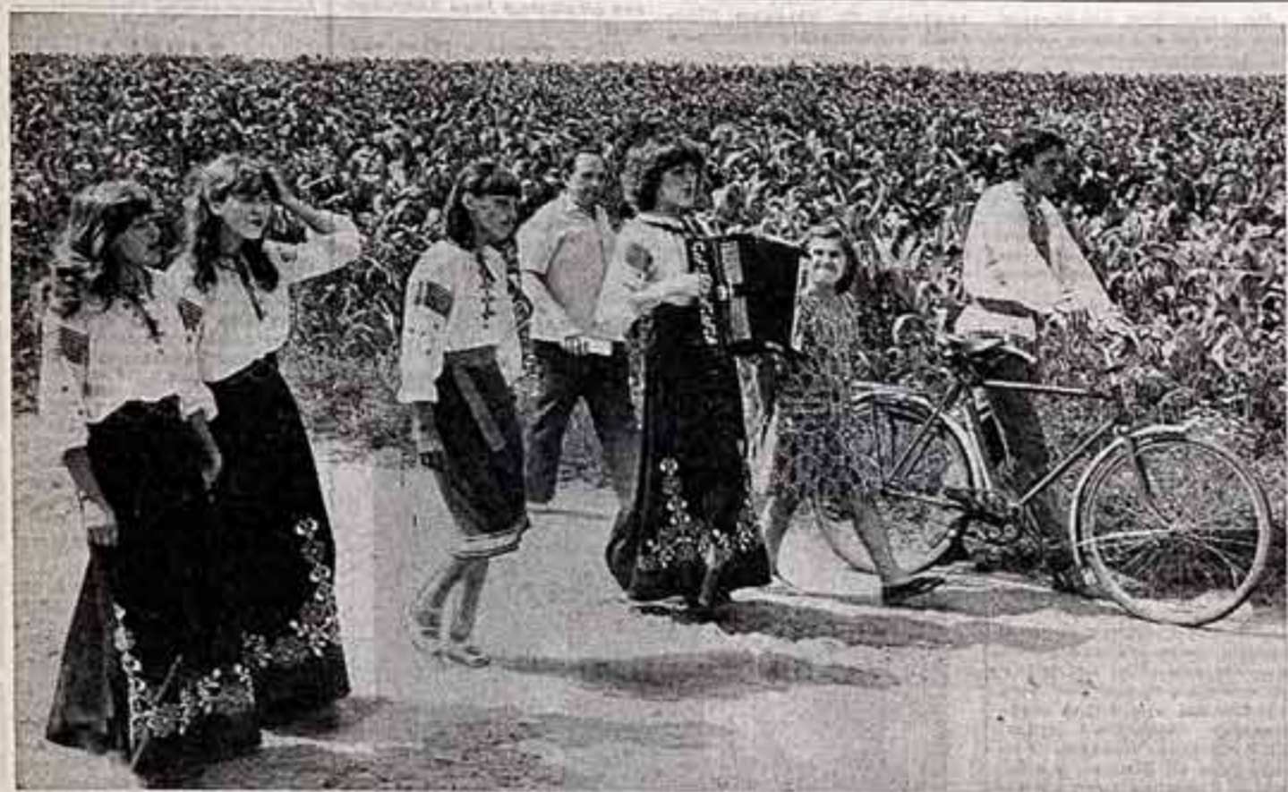
Возвращаясь домой после выступления перед механизаторами колхоза имени XXII съезда КПСС участники самодеятельной народной агитбригады села Пятыйки, что на Волыни.