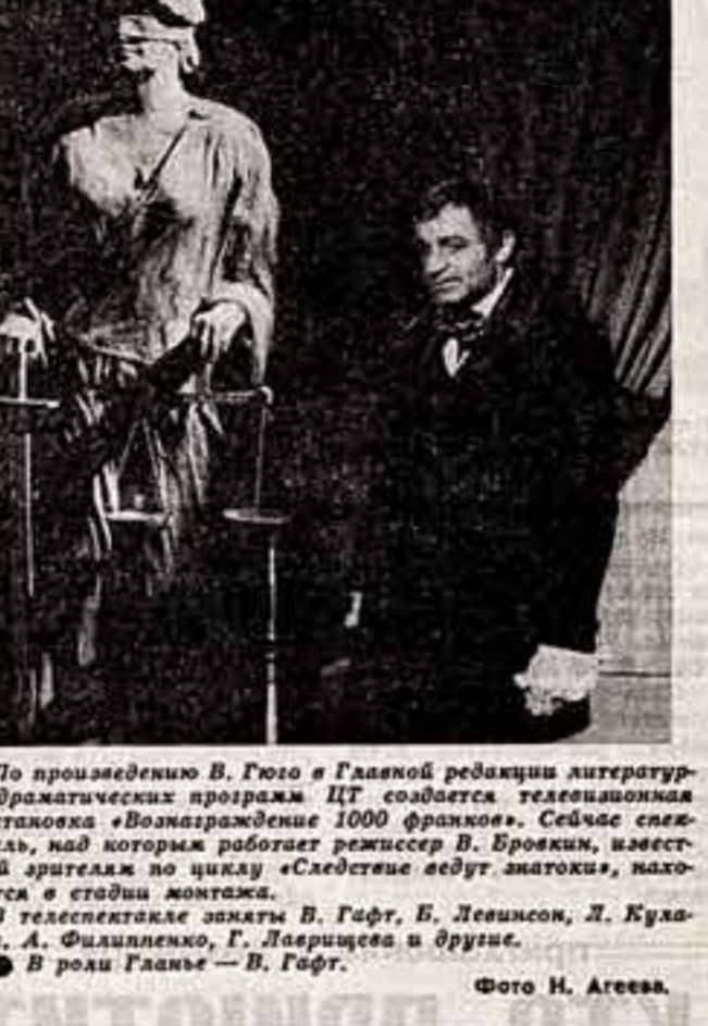
По произведению В. Гюго в Главной редакции литературно-драматических программ ЦТ создается телевизионная постановка «Вознаграждение 1000 франков»...