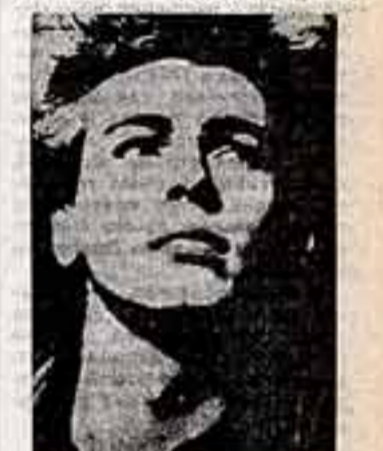
Когда Иво Погорелли спрашивают о афганском Погорелли, он отвечает: «Мою науку игры можно назвать классической. Мой идеал в музыке — классический, приближенный к замыслу композитора. Я играю и ультрамодерные композиции. Однако мне кажется, что авангард должен быть по крайней мере нам, по крайней мере, нам, например, Соната номер три великого Бетховена, произведение, которое каждый из нескольких тысяч слушателей имеет право и должен слушать так, как будто оно исполняется только для него одного. Нам, наследству оставлено огромное богатство музыкального творчества, которое нужно открыть и читать. И это чтение нужно прежде всего молодому».

«Синономленные» кинокомпании-грабительницы средств.