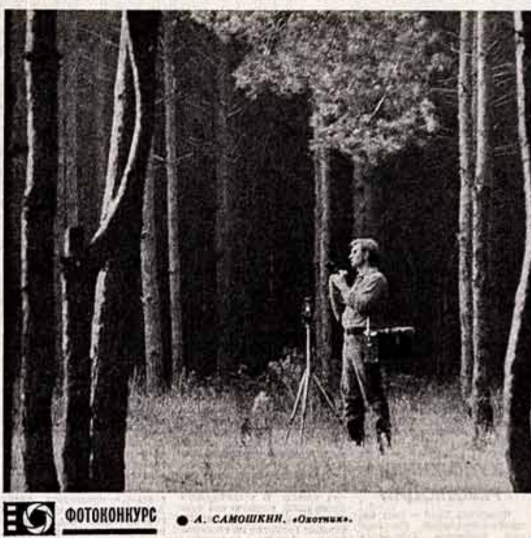
ФОТОКОНКУРС А. САМОШКИН. «Охотник»