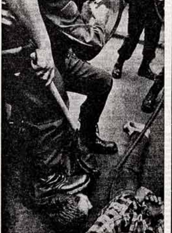
Будни в свободной ФРГ: свобода под сапогом — эти молодые люди участвовали в антивоенной демонстрации.

Когда Иво Погорелли, молодой югославский пианист, берет концерт в огромном зале «Сала» в Белграде, то там нет не только ни одного свободного места, но и на улице перед входом остаются еще множество желающих, которых не достает «лишних билетов».