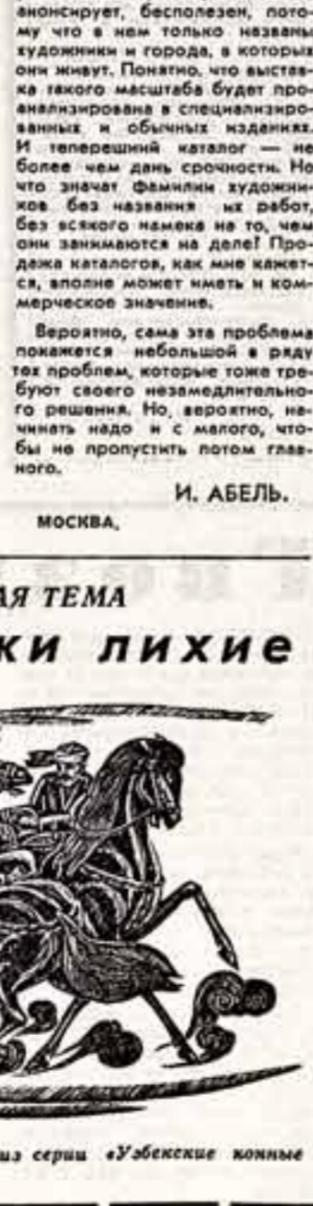
К. Башаров. «Борба» из серии «Узбекские конные игры».