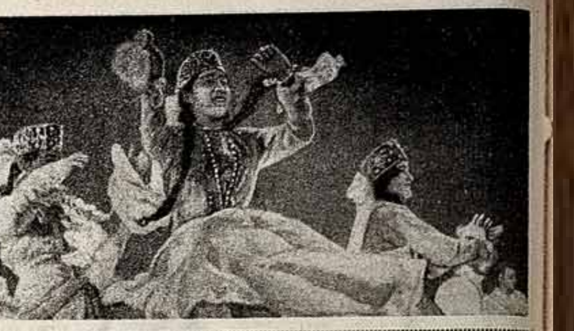
На сцене: музыкально-танцевальный ансамбль «Молодежь» в исполнении девушек из Ленинобада.

— Мы ЗАМ пригласили спортивцев — билеты на премьеру спектакля Юношеского театра «Крумомский роман», — сказали нам товарищи из местного отделения Союза чехословако-советской дружбы.