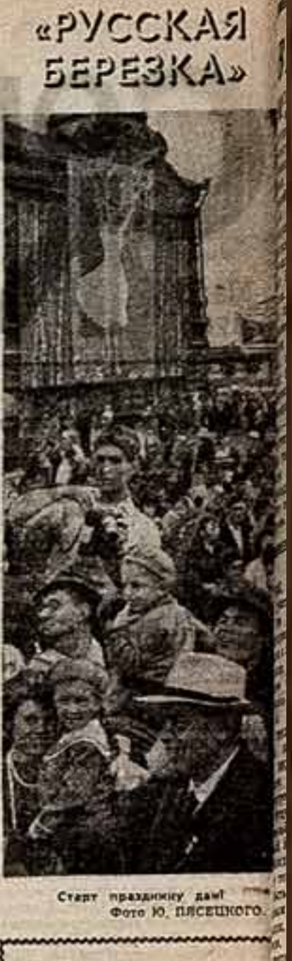
Старт праздника дачи.

Вопрос преподавательских студентов, за что издеваются критиковали? Долго молчали, нерешительные ответ: «За материализм».