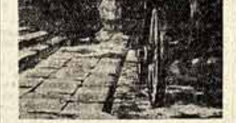
Л. Подляская. Иллюстрация к повести Гоголя «Нос».

Наша общественность не раз подвергала суровой и справедливой критике осуществ-