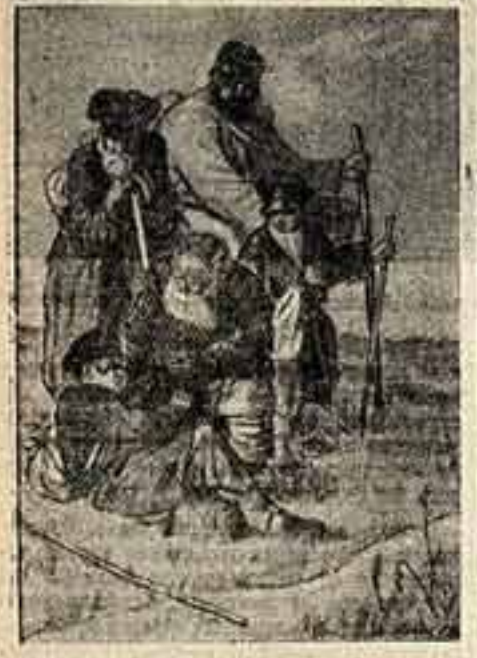
И. Астафов. Иллюстрация к «Переселенцам» Д. Григорьева.

Постоянное, неслабое внимание, которое уделяется в нашей стране вопросам развития литературы, увеличение тиражей издаваемых книг, забота о качестве изданий, о красоте оформления книги позволяют нашему читателю быть требовательным и пристрастным в выборе книги. Советский