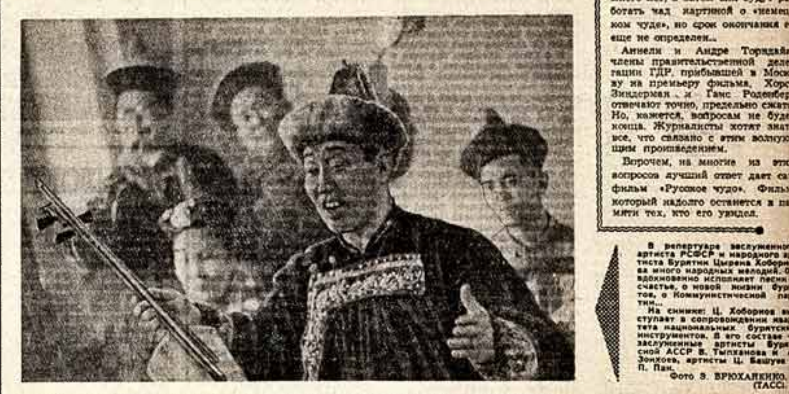
Сов. культ. У июля 1963

ТРУДНО ОПРЕДЕЛИТЬ масштаб работы неслыханной армии деятелей советской культуры и искусства. Работа эта кипит и спорится, грандиозные итоги ее — украшение мировой культуры. Но это, конечно, не означает, что все в советском искусстве безупречно, что нет необходимости что-то улучшить, а подчас и исправить. И потому благодарностью думает о руководителе нашей партии и правительства, которые постоянно ведут с нами, деятелями культуры, разговор о высоком назначении искусства, о его роли в жизни нашего общества. Это свидетельствует о том, какое великое значение придает Коммунистическая партия искусству в общем строе идеологической борьбы, о том, как заботится и требователен ее Центральный Комитет к работникам культуры.