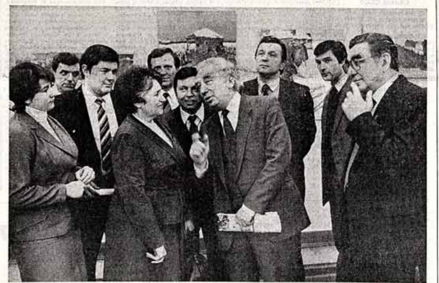
В Деме культуры производственного объединения «Мосмедпрепараты» состоялась встреча избирателей Кантемировского избирательного округа...