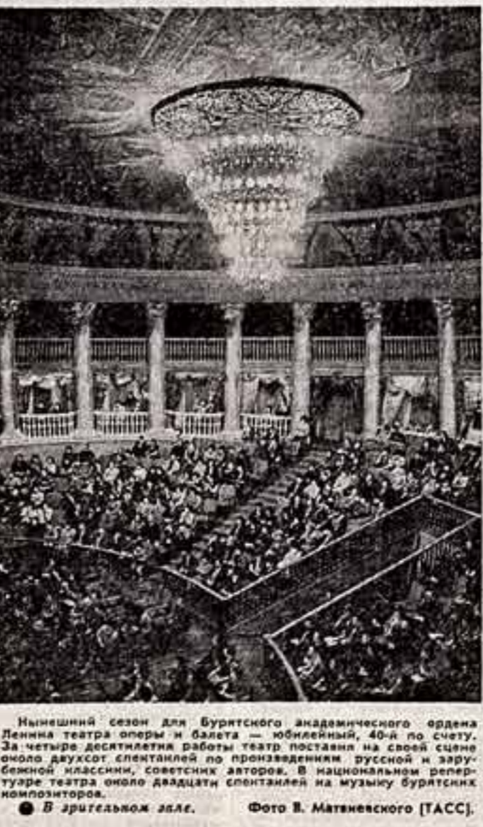
Минувший сезон для Буритского академического театра — юбилейный, 40-й по счету.

Эмонуэль Калонтаров работает в кино много и плодотворно. Историко-революционный фильм «Уральский комиссар».