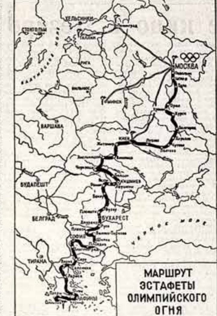
МАРШРУТ ЭСТАФЕТЫ ОЛИМПИЙСКОГО ОГНЯ

Министерство культуры ССР, ЦК профсоюза работников культуры, Московская государственная консерватория имени П. И. Чайковского.