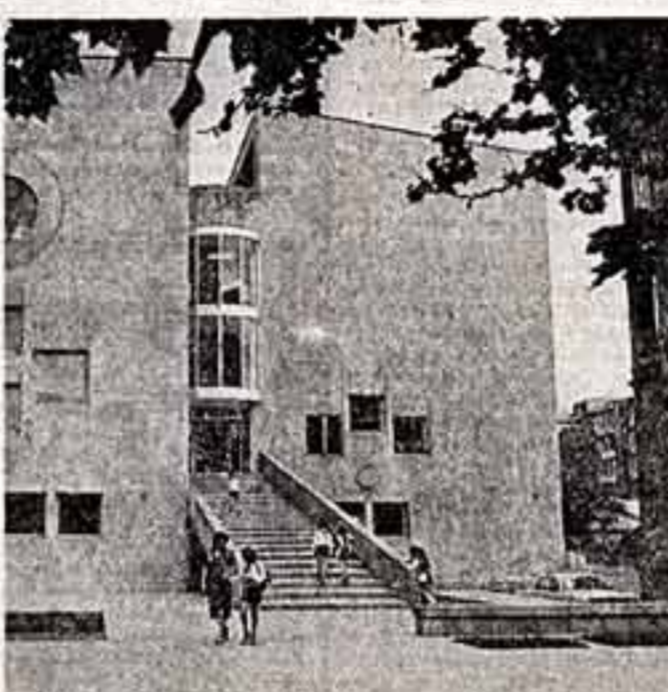
Армянская республиканская детская библиотека имени писателя Химо-Алера (Атабена Хюниана) свое 30-летие со дня основания встречает в новом здании, построенном в центре города. Услугами библиотеки, в фондах которой свыше 270 тысяч книг, пользуются более 20 тысяч юных читателей. Четыре этажа новостройки отведены под читальные залы.

Первые пассажиры приехали в Саранск — столицу Мордовской АССР. Он открыт в честь шестидесятилетия революции. Здесь построена современная бетонная полтора, оборудованная дополнительными помещениями для технических служб. На этой основе улучшилось обеспечение авиалайнеров. Увеличено число дальних рейсов. А. ПАПЕТА, САРАНСК.