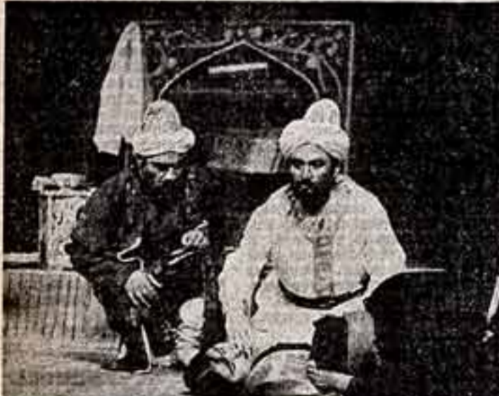
Хорезмский областной театр музыкальной драмы и оперы имени Огхи...