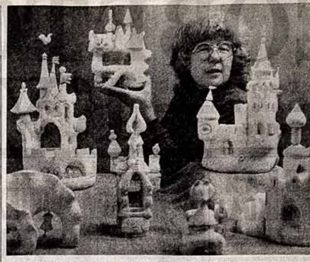
В Волгограде заканчивается строительство нового Дворца молодежи. А рядом с ним архитекторы планируют создать детский игровой комплекс. Составной его частью станет сказочный городок, проект которого создала скульптор Надежда Павлова.