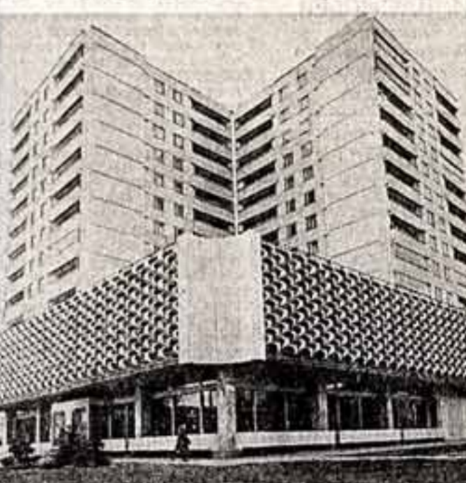
Новое здание дома книги «Прометей» украсило центр города Великий Новгород. Площадь торговых залов групповых и республике книжного магазина занимает около девяти тысяч квадратных метров.