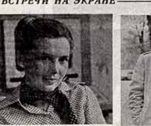
Надежда Шумилова в фильме «Требуются мужчины»