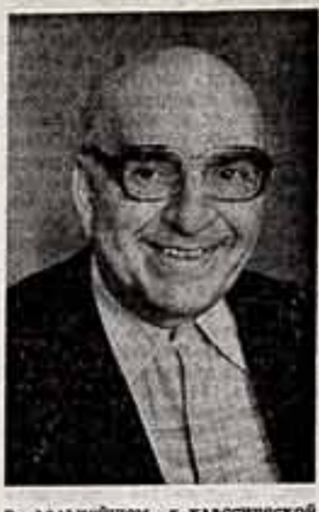
В. Канделаки, народный артист СССР