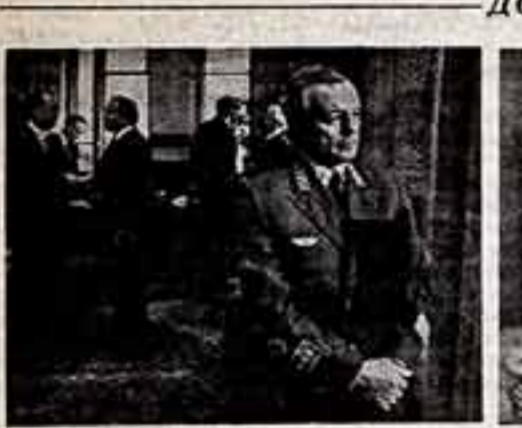
Кирилл Лавров в фильме «Мастера»