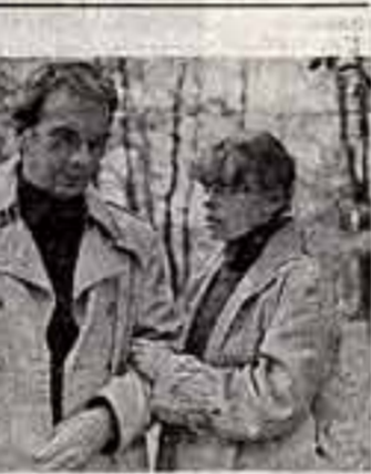
Алексей Баталов в фильме «Скорость»