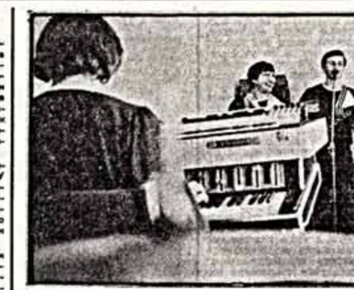
В совхозе имени 50-летия СССР Рязанской области открылся новый Дом культуры. Здесь работает ряд коллективов художественной самодеятельности: танцевальный, хор, ансамбль инструментальной музыки и ансамбль.