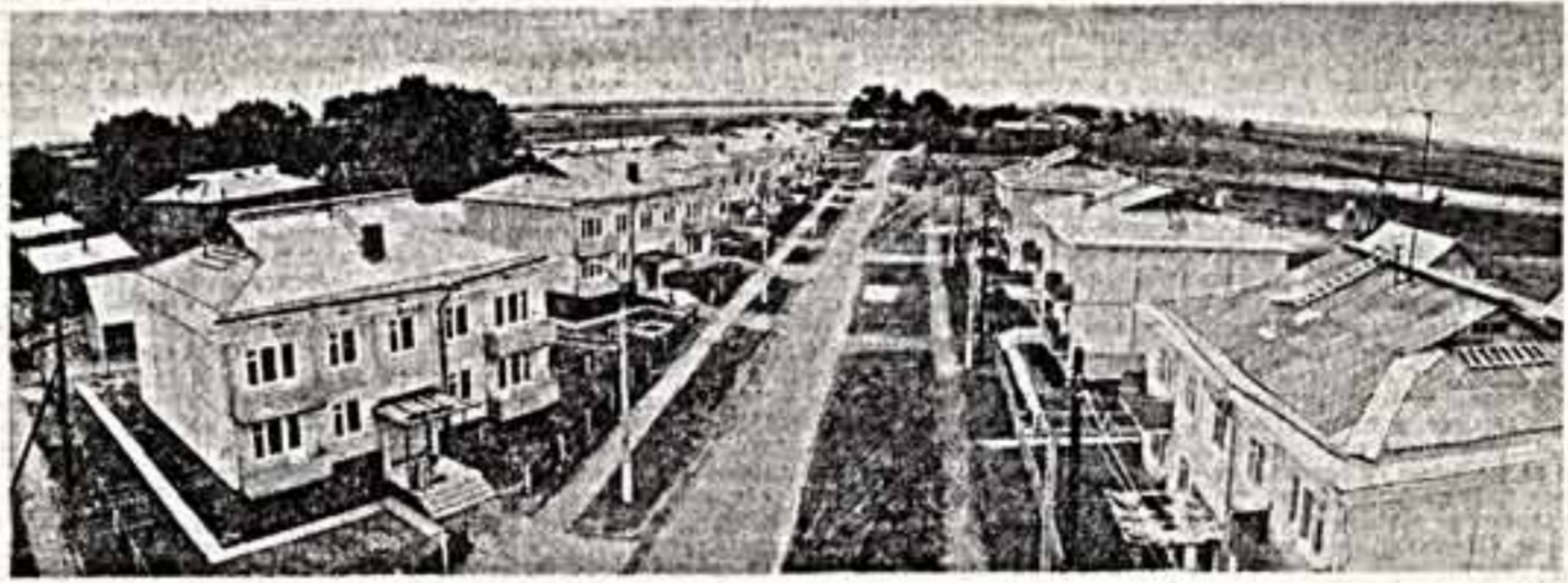
Первый колесник на строительстве усадьбы Архангельского совхоза-техникума Приморского района Архангельского государственного треста № 3 Гагаринского треста забили кооперативной землей.

Исключение! Ум, правило. Государственный план строительно-монтажных работ на сооружение объектов культуры в республике предусматривает 7 миллионов 23 тысячи рублей.