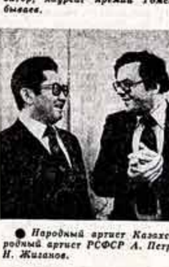
Народный артист Казахской ССР Р. Рахматиев, народный артист РСФСР А. Петров и народный артист СССР И. Жиданов.