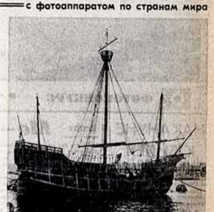
с фотоаппаратом по странам мира В ОБЪЕКТИВЕ — БАРСЕЛОНА «Шхуна Кокумэ» — морской музей и причал Барселонского порта. Графика И. Пикассо живет в архитектуре.

обрели новые яркие черты. Успешно поставлен и многом постановкам оркестральные декорации и музыкальные декорации Ханойского драматического театра давно заслужили в стране славу первооткрывателей. Он поздравил вьетнамского зрителя со многими драматургическими произведениями современных писателей Советского Союза и других братских социалистических стран. Вот уже несколько лет здесь с постоянным успехом идут «Тринадцатый номер» М. Погодина, «Мы — русский народ» В. Шингарова, «В добрый час!» В. Розова, «Заседание перлов» А. Гельмана. Обращение нашего театра к произведениям европейской классики, — говорит Нгуен Дин Тхя, — совсем не случайное. В этой пьесе мы попытались найти черты, которые соответствуют нашему времени. В работе над спектаклем нам помог опыт ведущих режиссеров мирового театра, при-