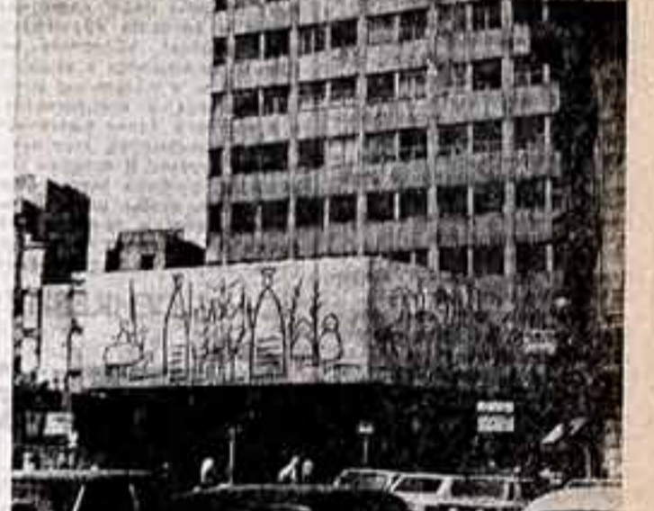
с фотоаппаратом по странам мира В ОБЪЕКТИВЕ — БАРСЕЛОНА «Шхуна Кокумэ» — морской музей и причал Барселонского порта. Графика И. Пикассо живет в архитектуре.