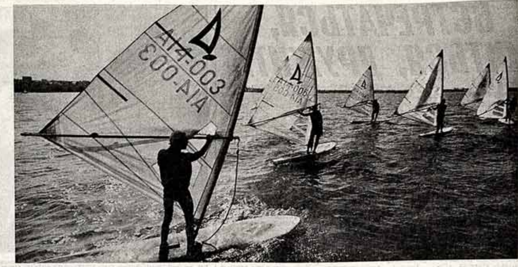
В. МАРУЩЕНКО. «Ветром волаи паруса».