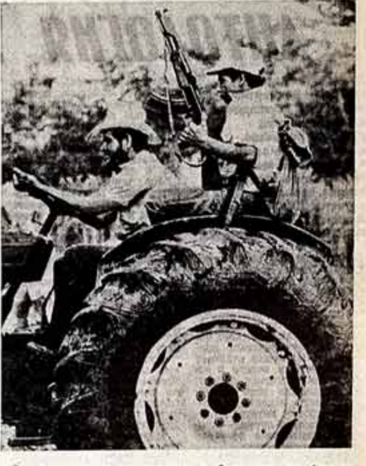
«Эпока», на страницах которого опубликованы эти фотографии: «Два мальчика, обделенных в Никарагуа, показывают, что народ этой маленюк страны живет свободной и постоянной труде. Работящие в поле крестьяне не расстанутся со своими ружьями — они готовы в любой момент отразить возможную агрессию со стороны США».