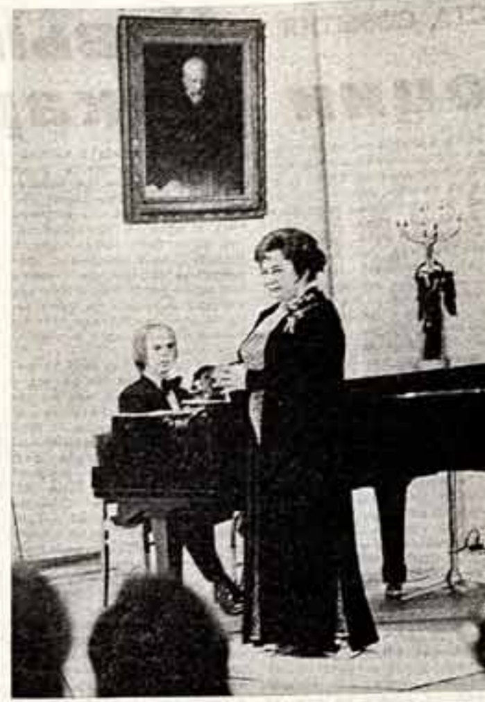
А. АНДРЕЕВ. Поэт Ирина Архипова.

К особенностям творческой манеры Ирины Константиновны Архиповой относится редкая естественность исполнения, вневременное величье ее голоса.