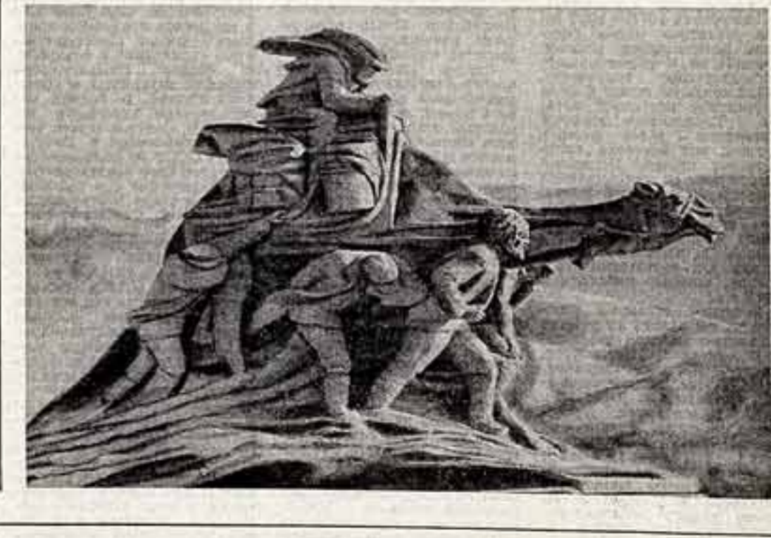
Символом Небиз-Датэ стал новый монумент «Покорители пустыни». Он воссоздает картину триумфальных побед, когда первооткрыватели преодолели песчаные бури, сильный зной и жажду, открывали здесь залежи нефти и газа.