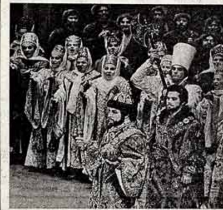
Сцена из оперы «Борис Годунов». Заглавную партию пел народный артист СССР Е. Нестеренко.

«Муж вошел, озяв и крахот, поздоровался с женой нарелев, самым старческим образом, и свалился на кресла так, как будто только что принес берем дров. Раздался глухой и продолжительный кашель...»