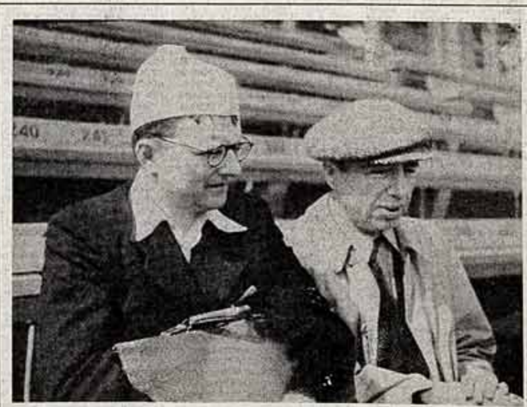
Этот кадр из фильма «Футбол нашего детства». Композиторы народные артисты СССР, Герои Социалистического Труда Дмитрий Шостакович и Матвей Блантер, запечатленные на трибуне стадиона «Динамо», очень любили футбол.