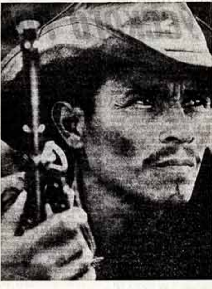
Вот что пишет корреспондент итальянского журнала «Эпока», на страницах которого опубликованы эти фотографии: «Два мальчика, обделенных в Никарагуа, показывают, что народ этой маленюк страны живет свободной и постоянной труде. Работящие в поле крестьяне не расстанутся со своими ружьями — они готовы в любой момент отразить возможную агрессию со стороны США».

С. ГОРБУНОВ, корр. ТАСС — специально для «Советской культуры», МАНГУА.