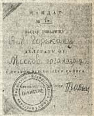
Делегатский мандат № 1 Выдан А. М. Горькому

Только в стране победившего социализма возможен такой исключительный съезд, каким является съезд писателей. Только величайшие успехи хозяйственного строительства и культурной революции, необычайно вышедшее благосостояние трудящихся масс могут обеспечить съезду глубочайшее внимание широкой пролетарской, колхозной общиности, могут сделать съезд родным делом миллионов. Только твердое руководство коммунистической партии, ее ленинского ЦК и вождя партии т. Сталина подарило советскую литературу к тем успехам, которые делают насущно необходимым союз съезда. Только заботливое внимание и правильная политика партии привели к боевой сплоченности советского писательского отряда. Пролетарии и колхозники нашей страны ждут, что после съезда советские писатели создадут еще более значительные, еще более яркие и убедительные романы, поэмы и драматические произведения о нашей прекраснейшей родине и ее лучших сынов. Страна культурного расцвета требует от писателей ярких художественных документов эпохи. Писатели оправдают надежды и доверие партии и масс. Горячий дружеский привет съезду мастеров литературы Советской страны, съезду летописцев радостной весны нашей замечательной родины.