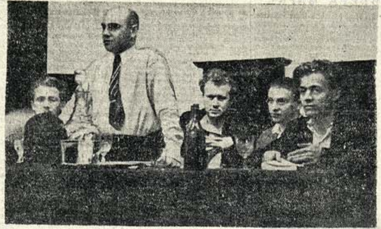
На всесоюзном совещании критиков в Москве