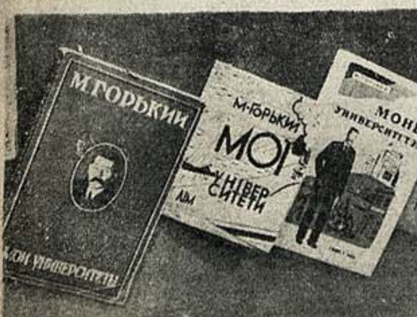
На выставке 46 лет советской художественной литературы.