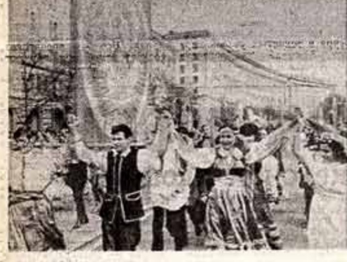
В колонне трудящихся Байкальской заводи имени Серго Орджоникидзе на первомайской демонстрации в Ленинграде.