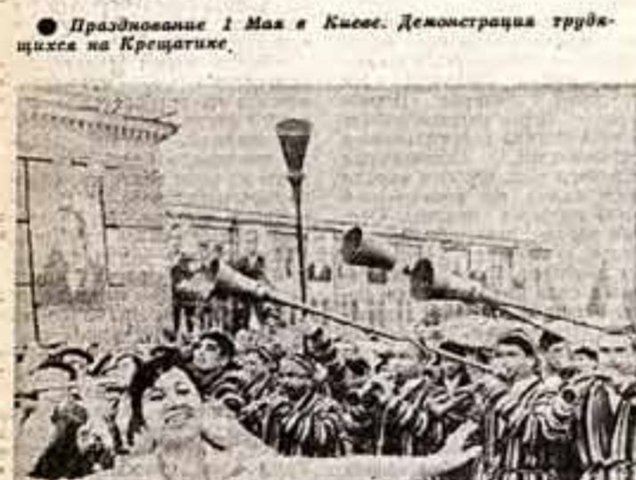
Празднование 1 Мая в Киеве. Демонстрация трудящихся на Крестьянке.