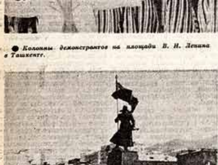
Колонны демонстрантов на площади В. И. Ленина в Ташкенте.