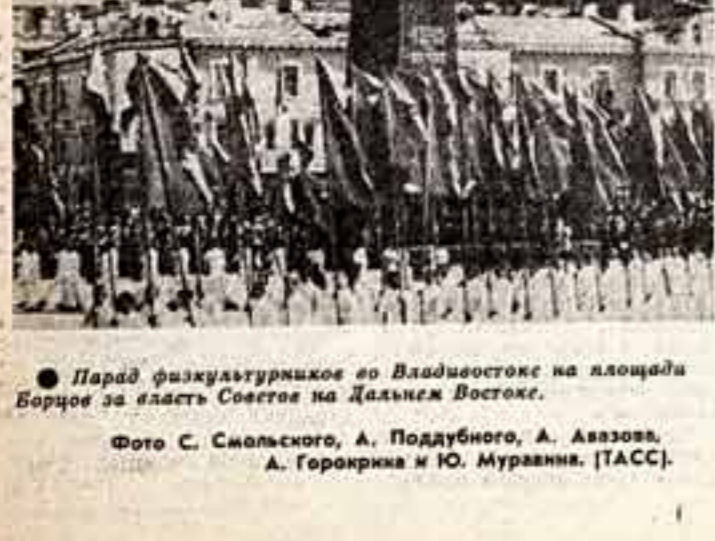
Парад физкультурников во Владивостоке на площади Борцов за власть Советов на Дальнем Востоке.

В своем заседании областной штаб дружелюбия отметил, что главной задачей комсомольских организаций и отделов культуры должно стать постоянное повышение идейного уровня культурно-просветительной работы на селе. А от кадров зависит, насколько высок будет идейный уровень работы. Они и вызвали наибольшую озабоченность. Кадры в области были