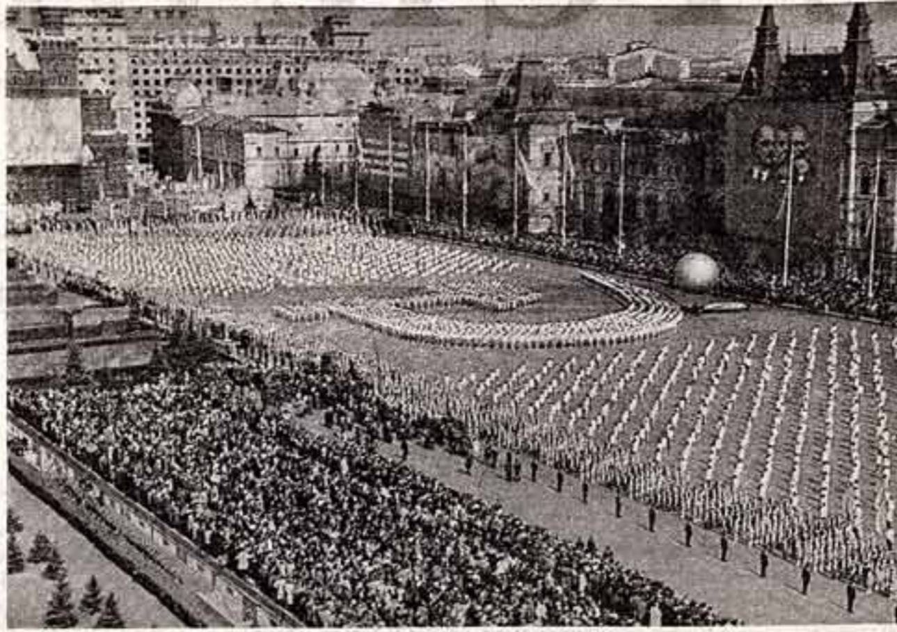
В праздничной демонстрации на Красной площади в Москве.