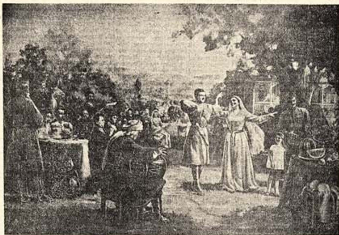
«Праздник в колхозе» (масло). Художник Г. Давиташвили.

«И вновь вспомню пелену историю с лавиантом Эгнати Ниношвили, запрещенным тифлисским губернатором...»