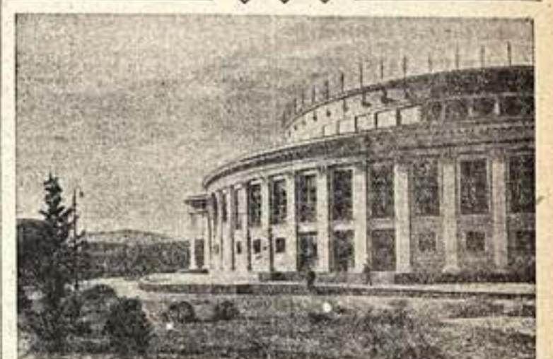
Новое здание цирка в Тбилисе. Авторы проекта — архитекторы В. Урушадзе, Н. Непринцев, С. Сатуни.