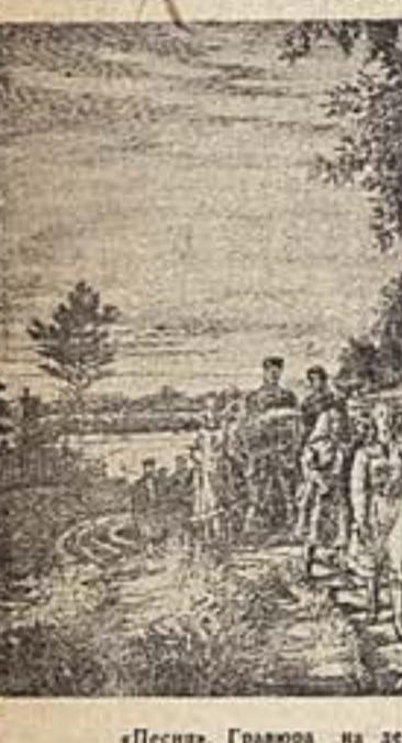
«Песня». Гравюра на дереве Ф. Константинова.

Пьеса сокращена для постановки на клубной сцене и в молодежных театральные коллективах.