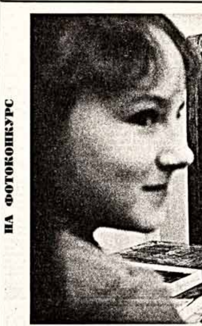
НА ФОТОКОНКУРС Я тебя рисую...