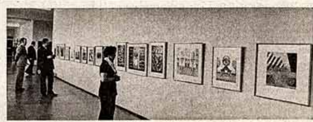
Эстонская ССР. Музей рыболовецкого колхоза имени С. М. Кирова Харьковского района располагает более чем 2.500 экспонатами. Некоторые из них относятся к XVIII веку. В музее, площадь которого 600 квадратных метров, есть также художественная галерея.

С большим воодушевлением было принято письмо VI съезда писателей СССР Центральному Комитету Коммунистической партии Советского Союза.