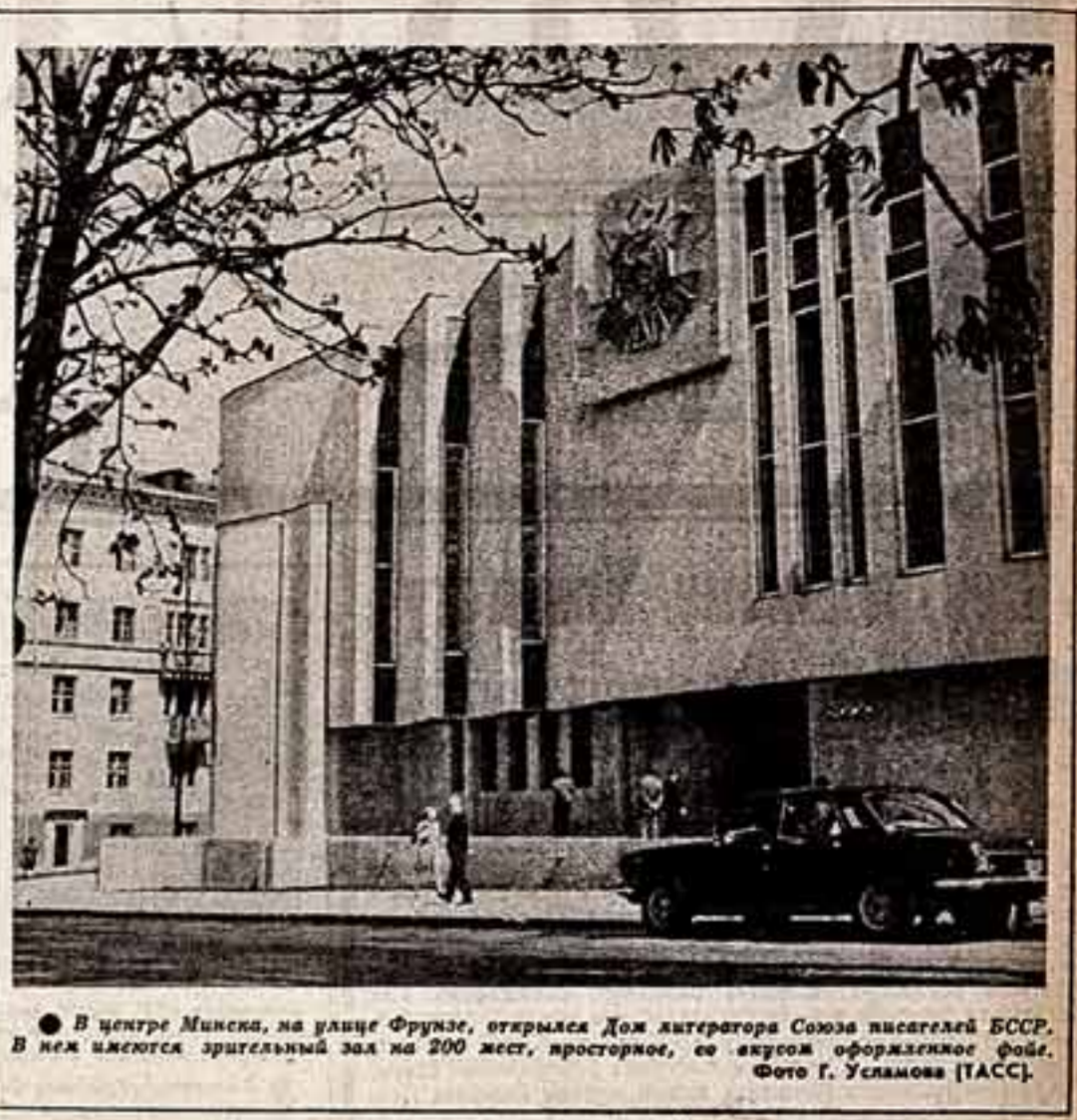
В центре Минска, на улице Фрунзе, открылся Дом литераторов Союза писателей БССР. В нем имеются зрительный зал на 200 мест, просторные, со вкусом оформленные кабинеты.