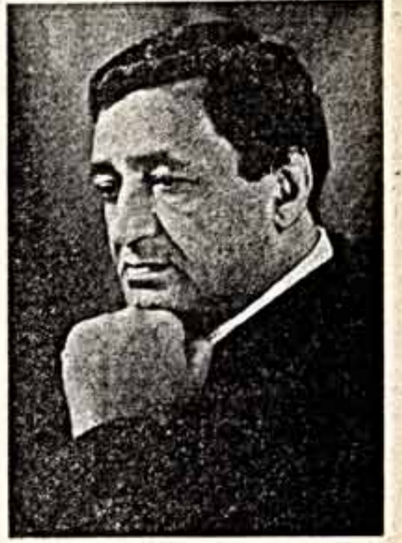
Национальный артист Азербайджанской ССР Ариф Меликов.