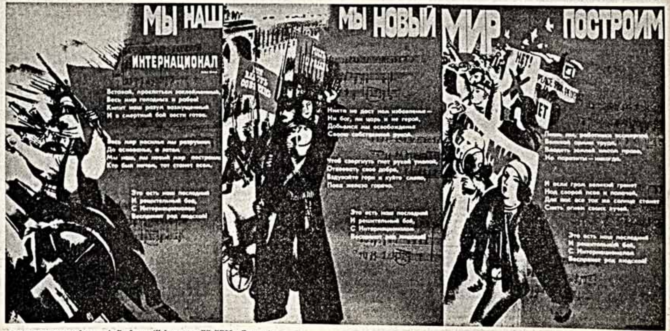
Автор плаката художник А. Кондров. (Издательство ЦК КПСС «Плакат»).