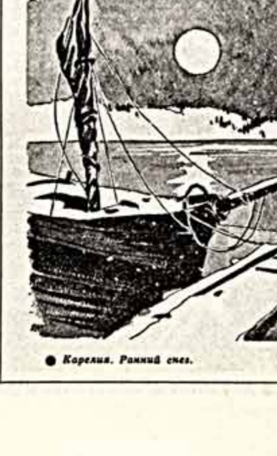
Рисунки Ростислава Мазанова.

С ФОМИН. Комментатор Центрального телевидения Юрий Миронов берет интервью у строителей БАМа.