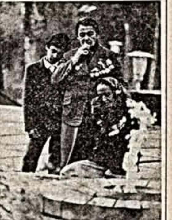
ВСЕГДА В ПУТИ

Мы были дождливым, ветром, слякотой, туманом, туманом и в туман, когда наши деды борьбой и страданиям в градации пути пролагали нам. Мы не забудем, мы не забудем, мы никогда не забудем. Про них. Друг мой! В мое время Почти оставшая Память героев Наверно родилась. Почти не оставшая В праздничном зале И — не распадайся По неспасу! Дыханье давшее — В трудных данях, В пути. Что они зовем! Они зовем! Почти не оставшая Новые заводы, Новые плотины Над белой сеной, Почти не оставшая Шумящая водопад Над покоренной целиной. ...Мы станем дождливым, ветром, слякотой, туманом и в туман. Зоркие внуки Почти не оставшая И — не распадётся По месту!