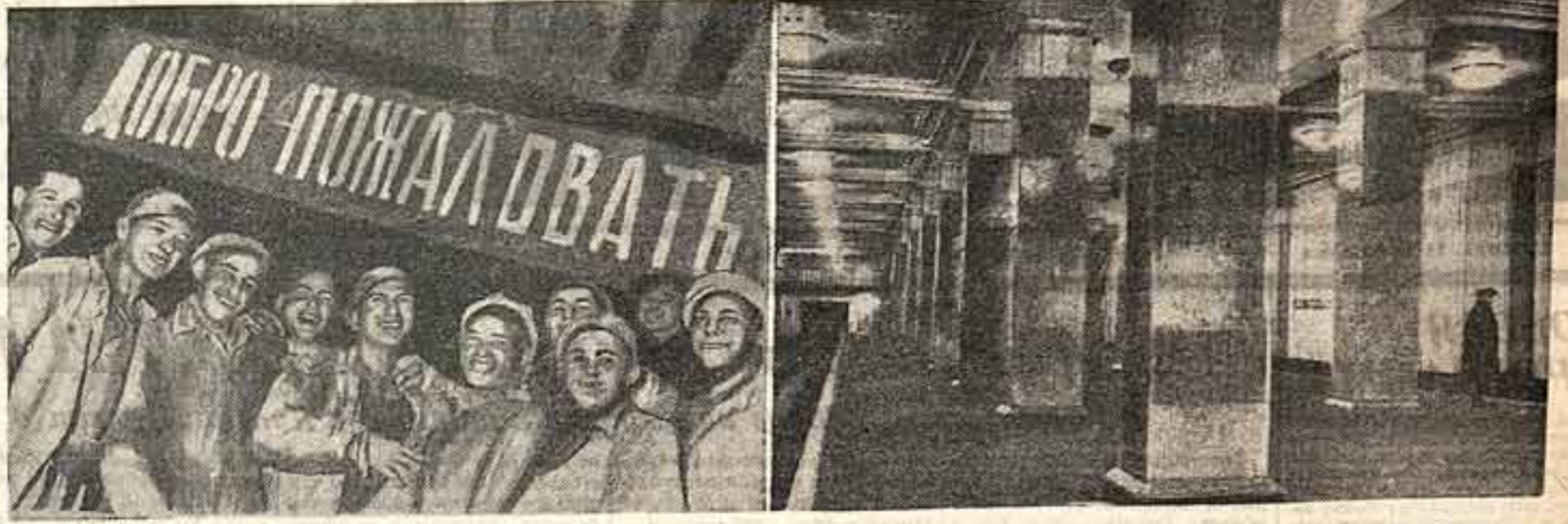
Слева направо: группа строителей метро, перрон станции «Крымская площадь»