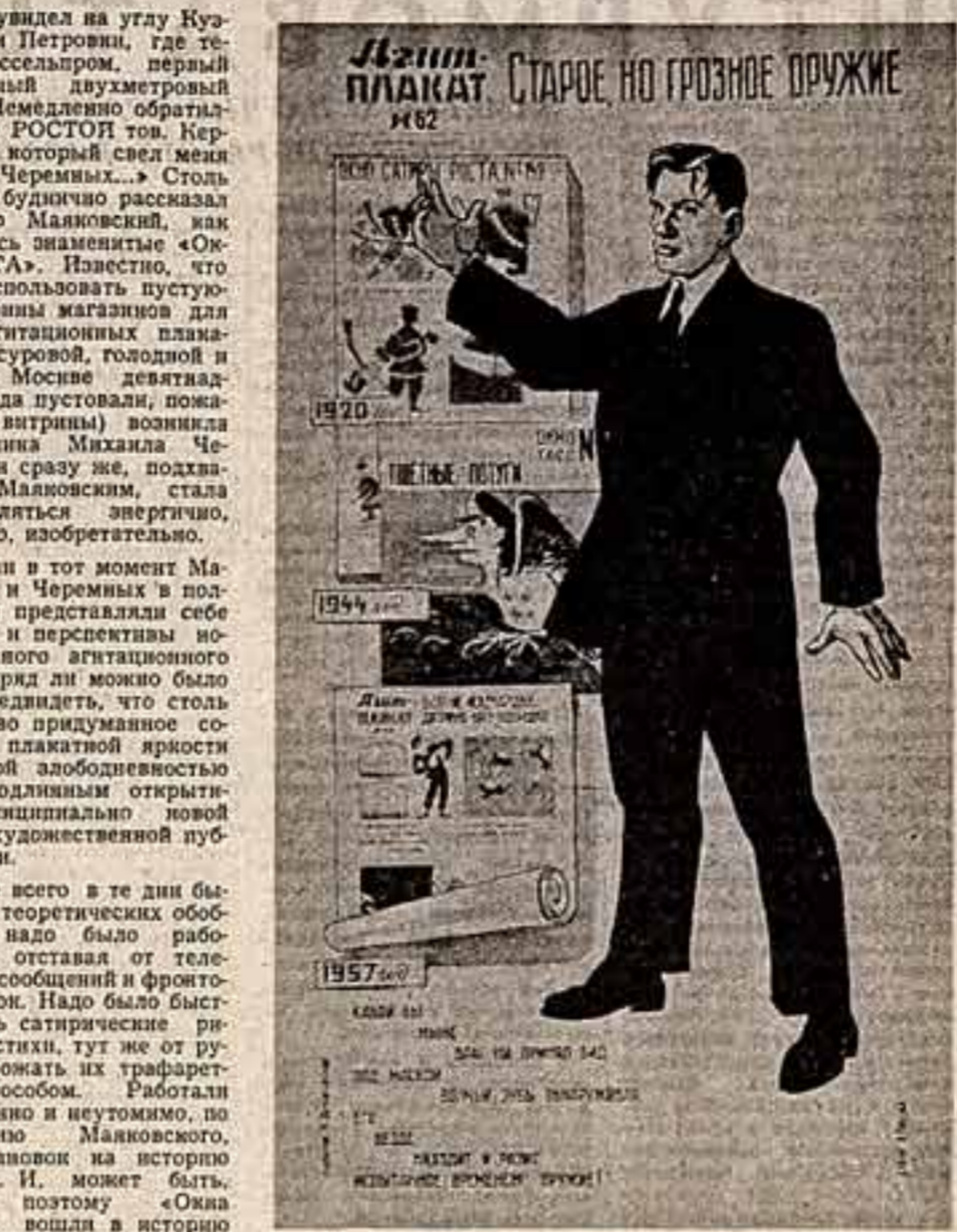
И. Демисовский. «Старое, но грозное оружие».

«... Я увидел на углу Кузнецкого и Петровых, где теперь Мосфильм, первый вышедший двухметровый плакат. Немедленно обратился к заву РОСТА тов. Керженцеву, который свел меня с М. Черемных...»