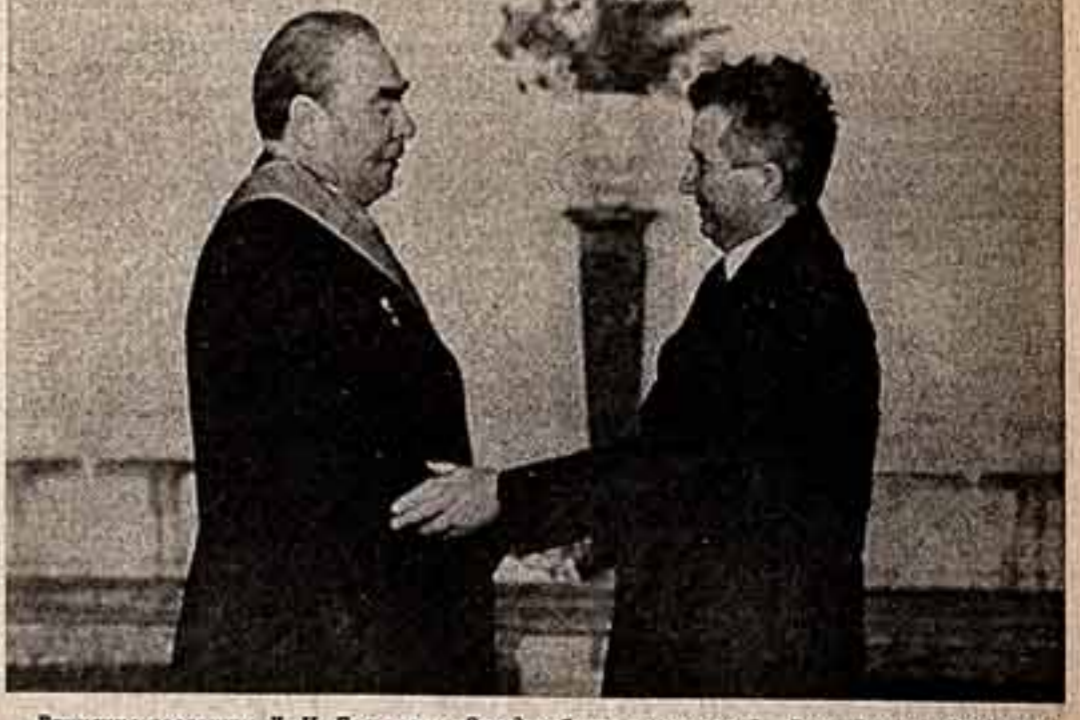
Вручение товарищу Л. И. Брежневу «Звезды Социалистической Республики Румынии» первой степени.

В зале находились член Политбюро ЦК КПСС, Председатель Совета Министров СССР А. Н. Косыгин, член Политбюро ЦК КПСС, министр иностранных дел СССР А. А. Громыко, секретарь ЦК КПСС К. Ф. Натусев, секретарь ЦК КПСС К. У. Черненко, член ЦК КПСС, помощник Генерального секретаря ЦК КПСС К. В. Русаков, кандидат в члены ЦК КПСС, помощник Генерального секретаря ЦК КПСС А. М. Александров, член ЦК КПСС, заместитель министра иностранных дел СССР Н. Н. Родионов, член ЦК КПСС, генеральный директор ТАСС Л. М. Замятя, член ЦК