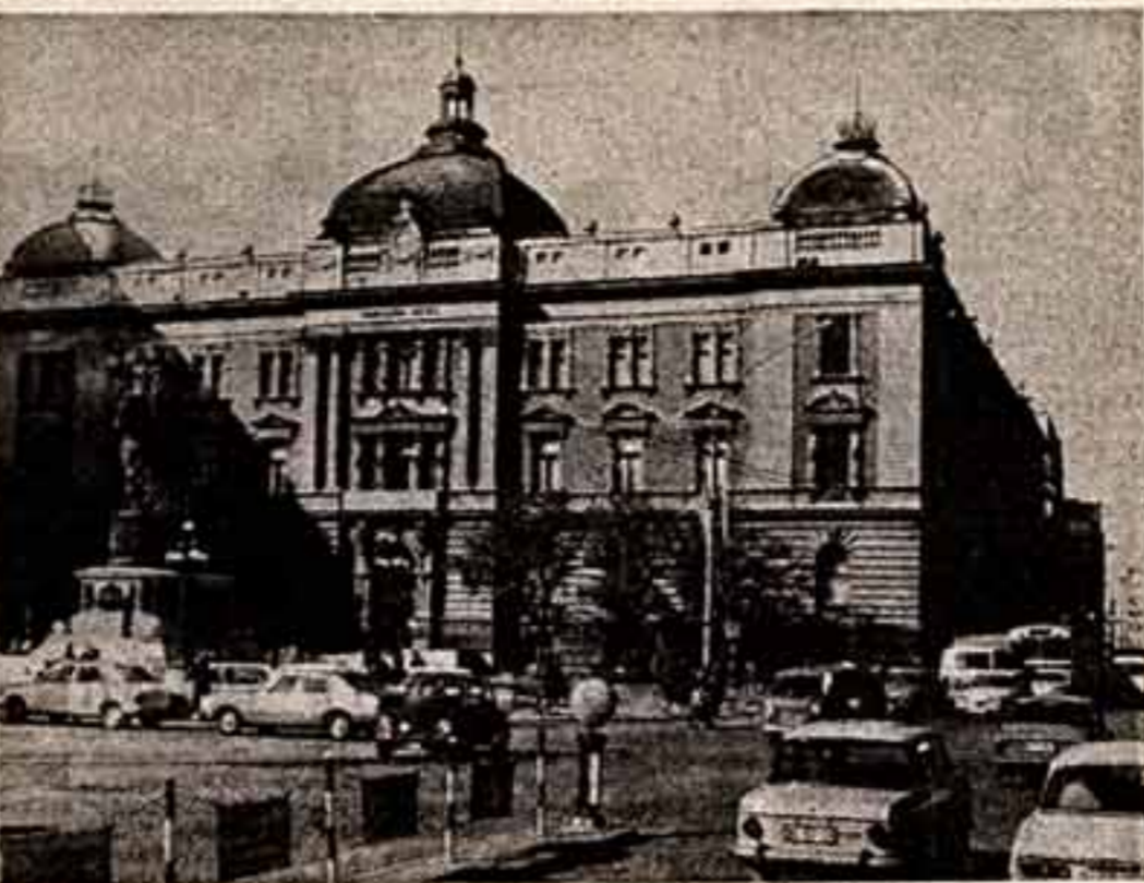
Народный театр на площади Республики в Белграде. Фото В. Мастонова (ТАСС).