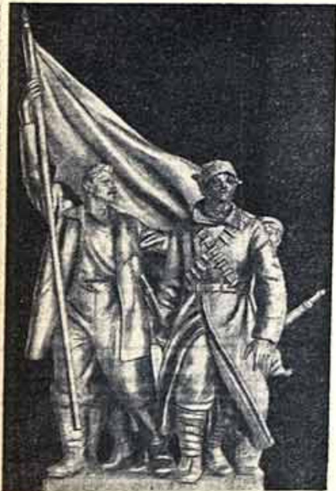
«Героика гражданской войны». Скульптурная композиция Л. Д. Мурзина и М. Г. Лысенко, устанавливаемая перед входом в советский павильон на Международной выставке в Нью-Йорке

Текст составлен заместителем комиссара советской части международной выставки в Нью-Йорке Г. И. Зарубиным