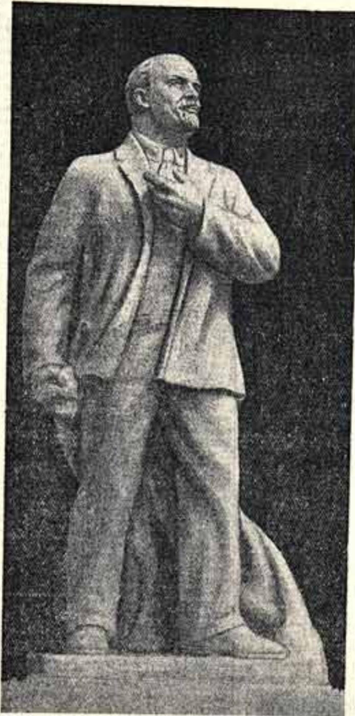
В. И. ЛЕНИН. Работа скульптора С. Д. Меркурова

Вместе со всем советским народом, рядом с знающими людьми нашей промышленности и сельского хозяйства, рядом с передовыми рабочими и колхозниками в первомайских колоннах будут идти знающие люди нашей науки, нашего искусства. Новая социалистическая интеллигенция, тесно связанная с народом, живущая его интересами, полнок отдавшая себя одному, общему делу, великому делу Ленина-Сталина, делу социализма, единодушно праредает свой голос к многонационному народу всей необъятной нашей страны, помощи сегодня гани победы и славы, гани радости и торжества, вдохновенный гимн победившего социализма.