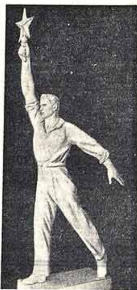
Скульптура, венчающая советский павильон на Международной выставке в Нью-Йорке. Работа скульптора В. А. Андреева

Текст составлен заместителем комиссара советской части международной выставки в Нью-Йорке Г. И. Зарубиным