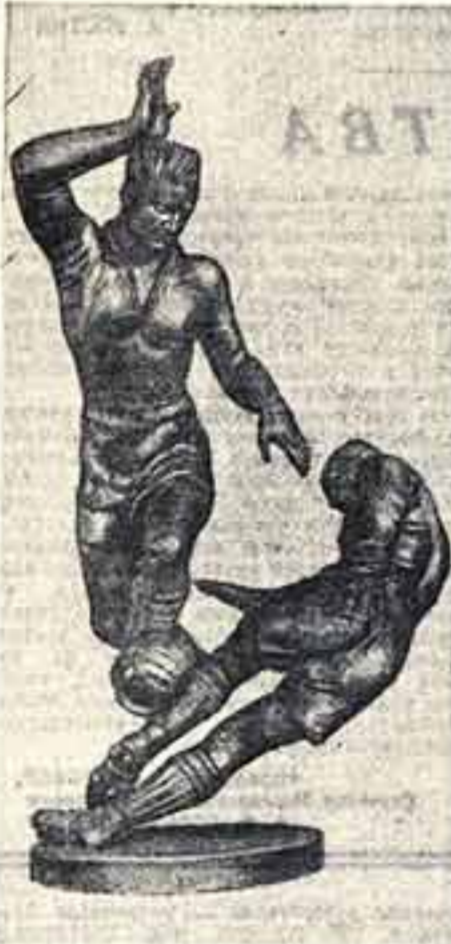
«Футболисты». Работа скульптора Чайкова, установленная в разделе «Физкультура» в советском павильоне