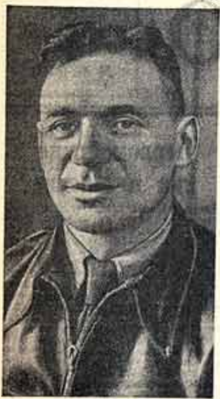
Командир самолета «Москва» Герой Советского Союза комбриг В. К. Коккинаки