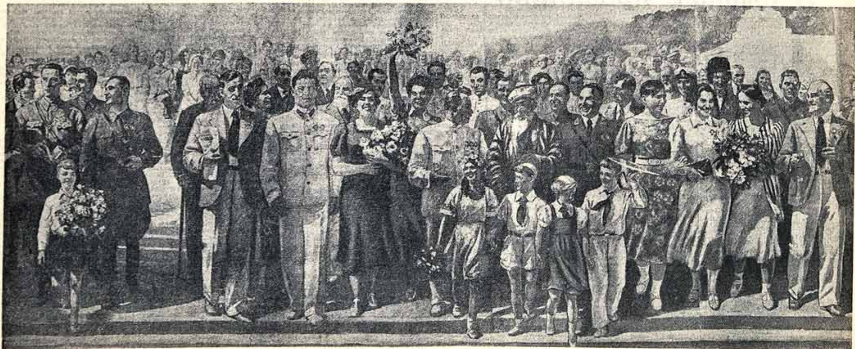
Художественное пано «Знамяте люди страны Советов», выполненное бригадой художников в составе А. Бубнова, Т. Гапоненко, В. Ефанова, В. Крайнева, А. Лаврова, Г. Нисского, В. Одицова, А. Пластова, К. Рогова, М. Сидорова, Д. Шаринова. Экспонат советского павильона на Международной выставке в Нью-Йорке. Фрагмент

В праздничные дни открываются нарки культуры и отдыха столицы. В Центральном парке культуры и отдыха им. Горького выступят артисты оркестра, пиры, участники художественной самодеятельности. В Зеленом театре пойдет фильм «Шор». В Сокольническом парке культуры и отдыха во время гуляний организуется конкурс пиры и танцоров.