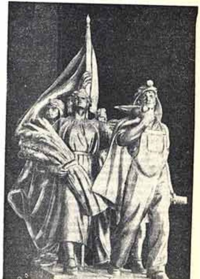
«Героика мирного строительства». Скульптурная композиция Л. Д. Мурзина и М. Г. Лысенко, устанавливаемая перед входом в советский павильон на Международной выставке в Нью-Йорке

Широко представлены живопись. На большом полотне, украшающем зал «Государственное устройство», изображено первое заседание Верховного Совета СССР (художники Савицкий, Христенко, Морозов, Карзин). На другом громадном холсте (160 кв. метров) изображена плеяда знатных людей нашей родины (авторы — художники Ефанов, Лапков, Ивский, Олинов, Платов, Бубнов, Швариков, Гавриленко, Саторов, Крайнов, Готоп).