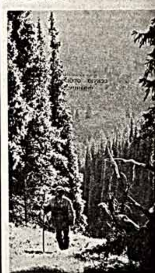
Указательные туристские походы, когда недержимо лают вперед, в немалых делах крайние просторы Родины...