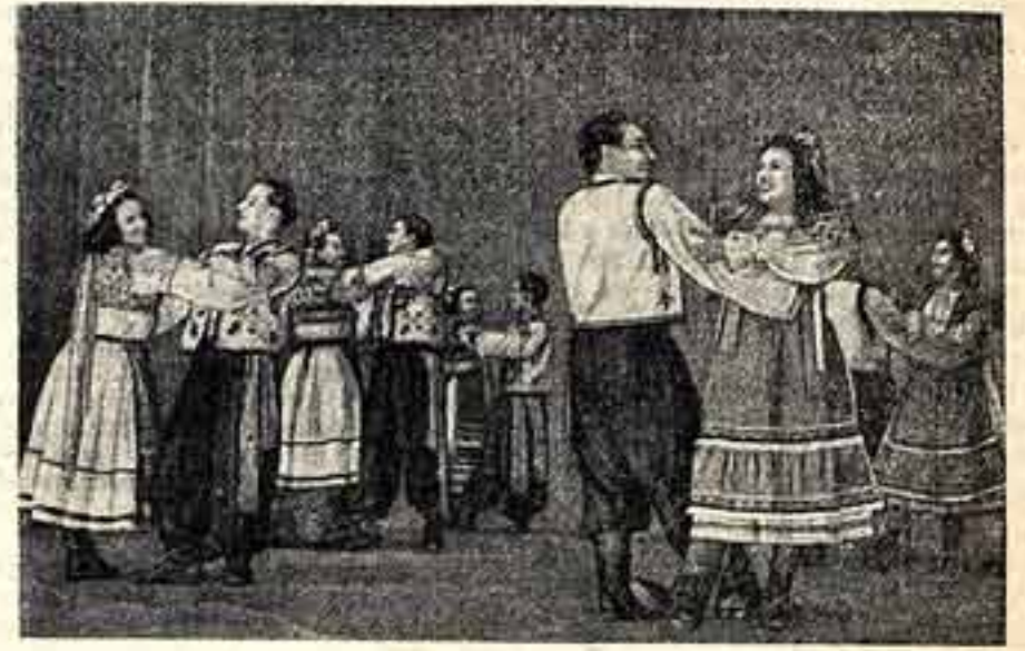
С большим праздничным тематическим концертом «Дружба народов» выступил коллектив художественной самодеятельности Рижского клуба строителей. Коллектив разучил танцевальную сенту «Дружба народов», в которую входят танцы народов СССР. На снимке: генеральная репетиция хореографической сцены «Дружба народов». Исполняется гушувский танец.