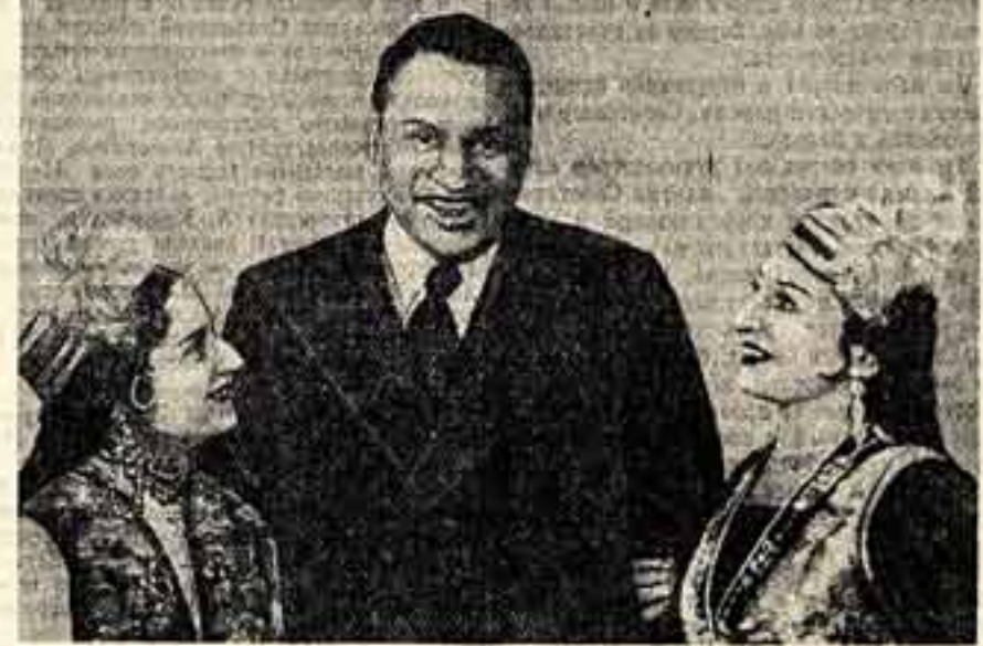
На снимке: Поль Робсон с участниками лекции узбекского искусства в Москве (1937 г.). В центре — Поль Робсон, справа — Тамара Ханум.