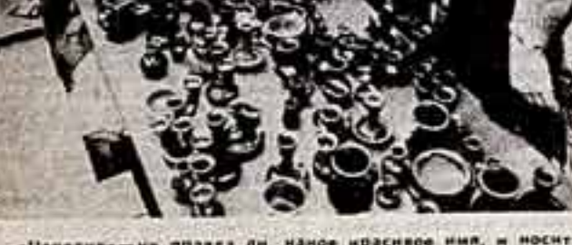
Целители на выставке-продаже керамических изделий...