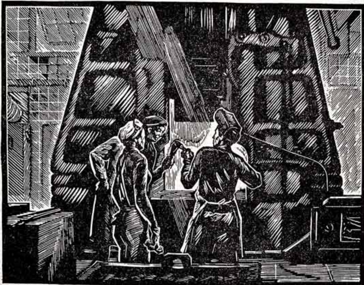
Гравюра из серии «Подольск индустриальный» создана В. Андрушкевичем после поездки по городам Подольска.

Именно потому она требует заботы и внимания со стороны партийных, советских, профсоюзных организаций, всех работников культуры.