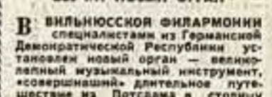
В Государственной филармонии Литовской ССР начались концертный сезон. На сцене симфонический оркестр филармонии.