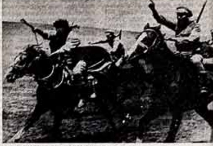
Кадр из фильма «Криво и вогнуто».