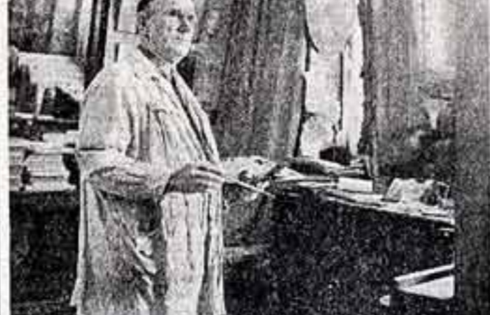
Л. ИВАНОВ. Известный советский живописец и график, народный художник СССР Сергей Васильевич Герасимов (1908 год).