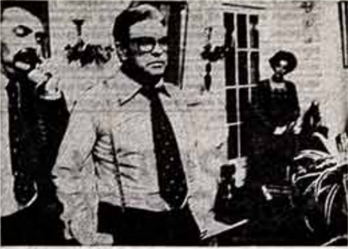
Кадр из фильма «Кентавры».