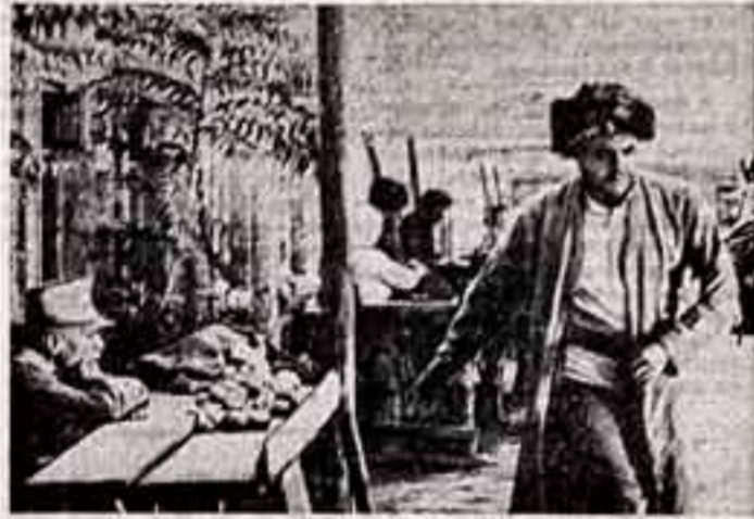
Кадр из фильма «Похищение скакуна».